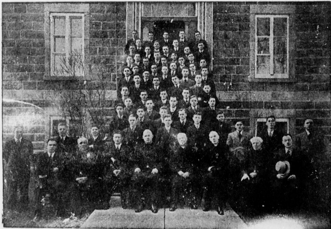
Groupe d'élèves agriculteurs pour l'année 1942.43