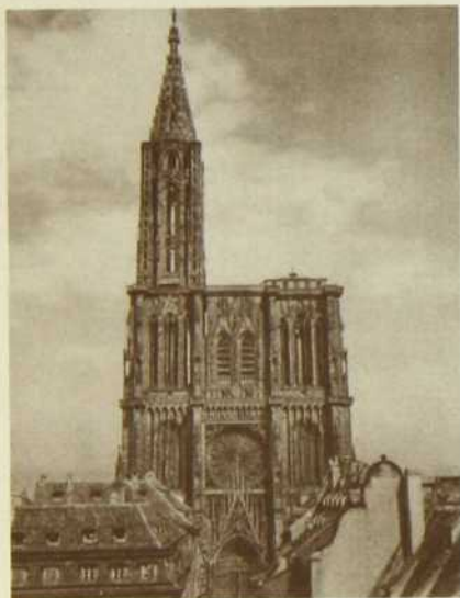
Strasbourg: la cathédrale