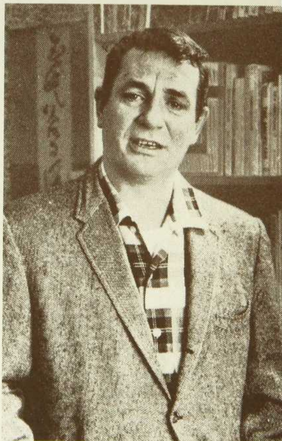
Jack Kerouac Documents, p. 4