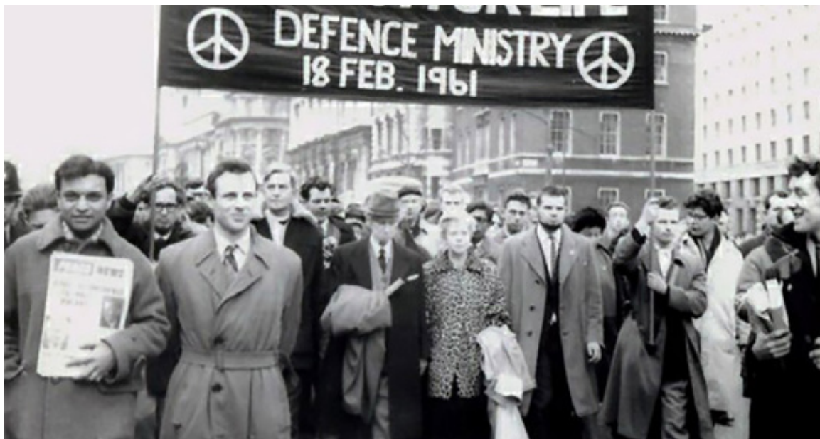
Bertrand Russell et son épouse, Edith Russell, mènent une manifestation anti-nucléaire du Committee of 100 à Londres, le samedi 18 février 1961

injuste, d'abord pour les personnes les plus durement touchées par la catastrophe, dont certaines sont présentement au front pour préserver la viabilité de leur terre. Sous ses airs de sérieuse lucidité, le défaitisme apparaît alors comme la justification rationnelle d'un renoncement moral et d'un désir de refuge hédoniste dans nos sphères privées et professionnelles. Mais l'attitude la plus commune – pleine de « bonne volonté » – est sans doute la plus désespérante : lorsqu'en dépit d'une reconnaissance verbale de l'urgence d'agir, voire de lutter, le même désir l'emporte par des considérations coutumières ; le temps manque toujours, les tâches et responsabilités débordent déjà, et puis faudrait bien un jour se remettre en forme et à