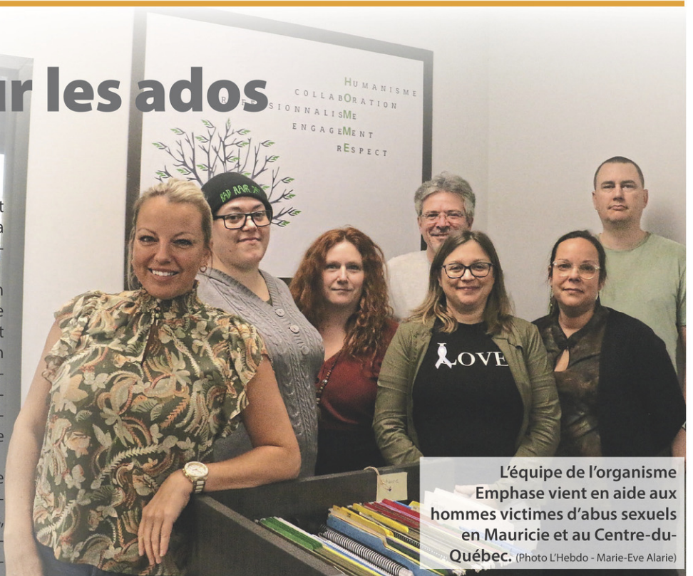
L'équipe de l'organisme Emphase vient en aide aux hommes victimes d'abus sexuels en Mauricie et au Centre-du-Québec.

Emphase Mauricie/Centre-du-Québec commence aussi à se déplacer dans les écoles secondaires pour parler de leur service pour les adolescents et, par la bande, aider les adolescents victimes d'un abus sexuel qui ne viendraient pas demander de l'aide. «On a notamment présenté nos services à l'école Paul-Le Jeune à Saint-Tite et à l'école des