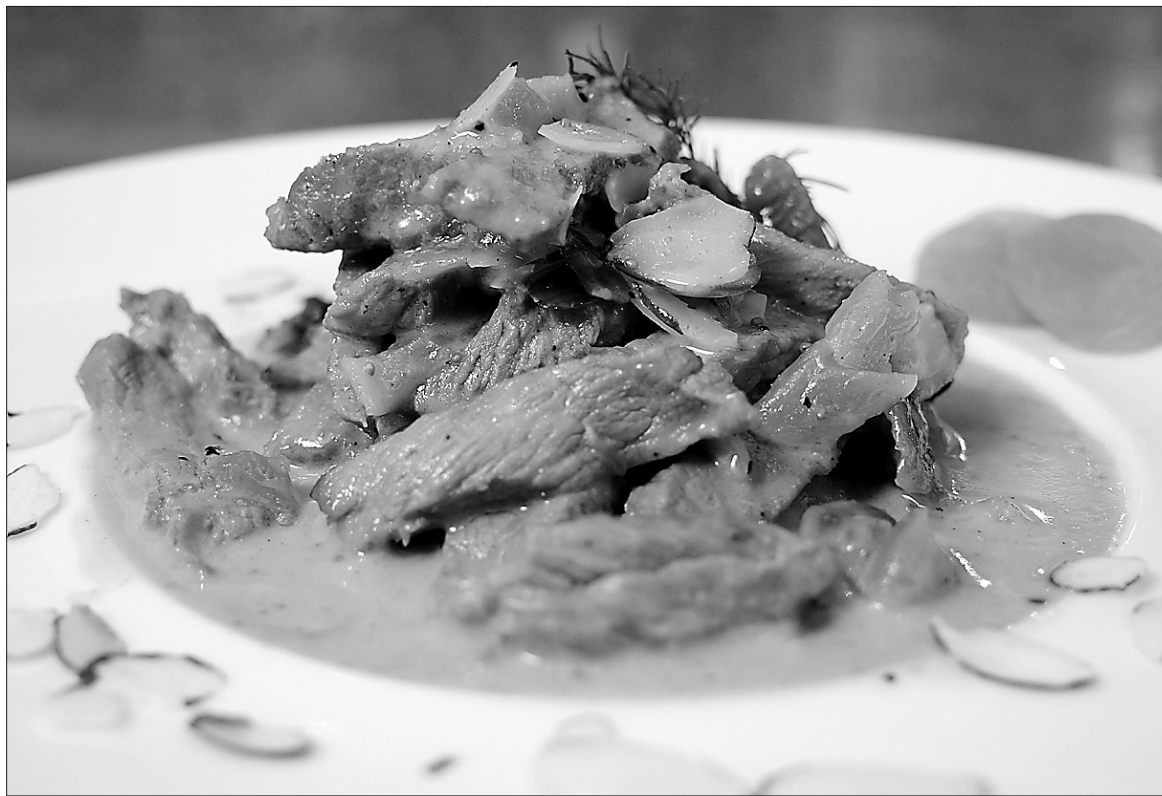
Minute de veau aux amandes et fruits secs

Oui, je comprends qu'en cette période où tout est devenu laï-