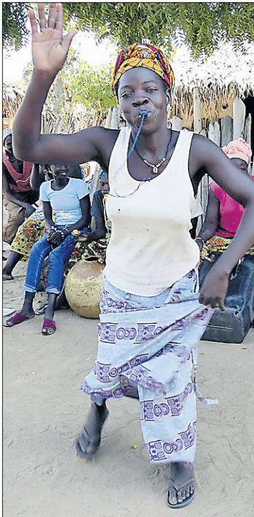
Les longs boubous colorés et cintrés portés par les femmes sénégalaises égaient le paysage.

Au départ, nous faisons étape dans le minuscule village agricole de Ndianda, composé d'une douzaine de huttes au milieu des baobabs. C'est la coutume pour nos amis de passer ici saluer les gens et leur laisser un sac de riz, des vêtements et quelques gâteries. Notre arrivée tire du sommeil les hommes, dont le chef Hibou, qui envoie les enfants chercher les femmes aux champs. Une fois la timidité estompée, nous aurons droit à une visite détaillée du