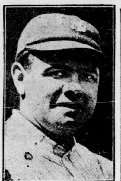
BABE RUTH se met à gronder. Il ne veut pas accepter la réduction de salaire que lui offre la direction des Yankees.

McGILL BATTU WEST POINT.—L'équipe de ballon au panier de l'Académie militaire a battu celle de McGill, par 36 à 18, dans une exhibition qui eut lieu hier mercredi.