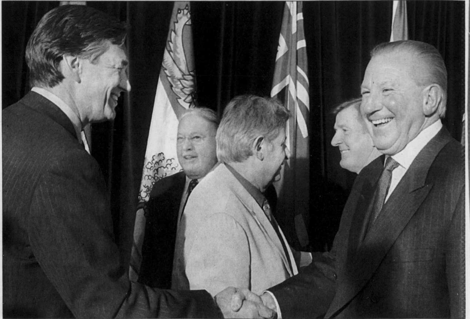
Les premiers ministres Gary Doer du Manitoba, Bernard Landry du Québec, Ralph Klein de l'Alberta, Roger Grimes de Terre-Neuve et Ernie Eves de l'Ontario se sont salués après leur rencontre.