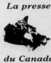
La presse du Canada