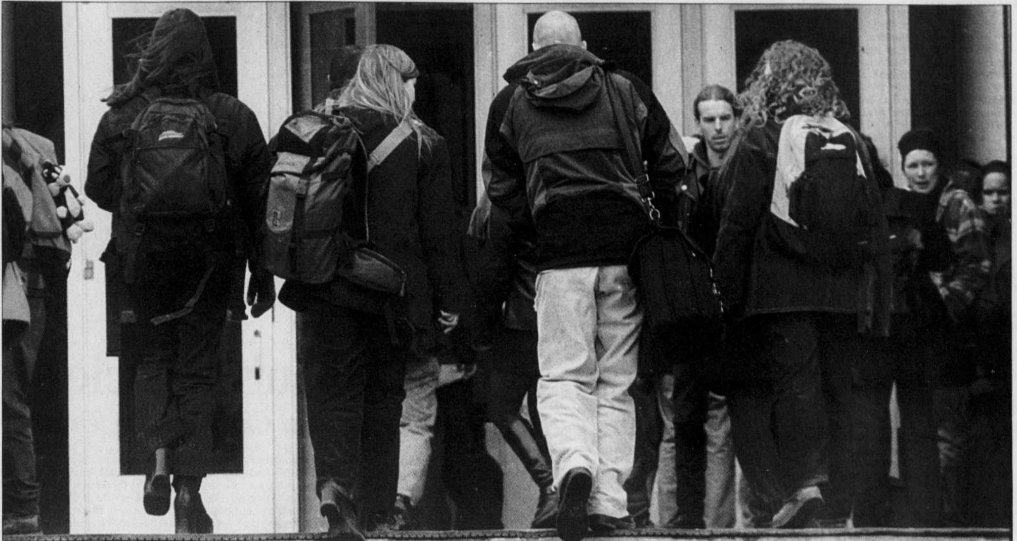
Les spécialistes proposent diverses stratégies pour faire baisser le nombre d'avortements chez les jeunes.