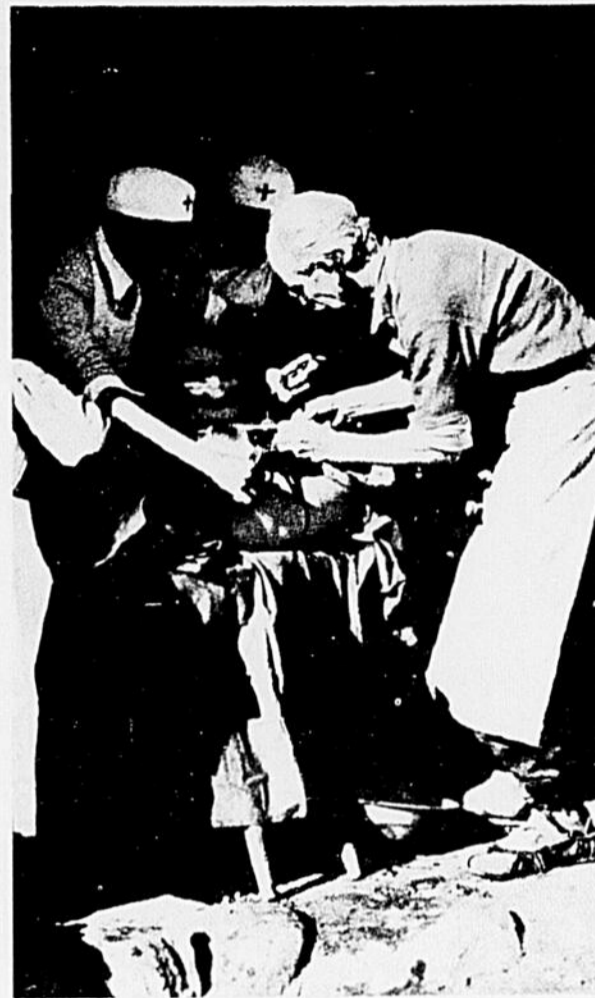
BETHUNE, à la table d'opération dans une salle de chirurgie improvisée, le 24 octobre 1939, moins d'un mois avant sa mort.