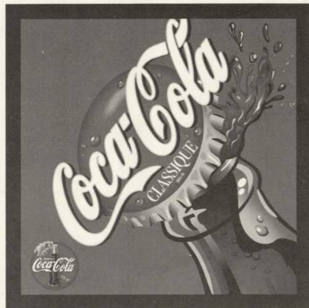
Les Embouteillages T.C.C. (Coca Cola Ltée)

*À l'exception de l'abonnement DÉCOUVERTE.