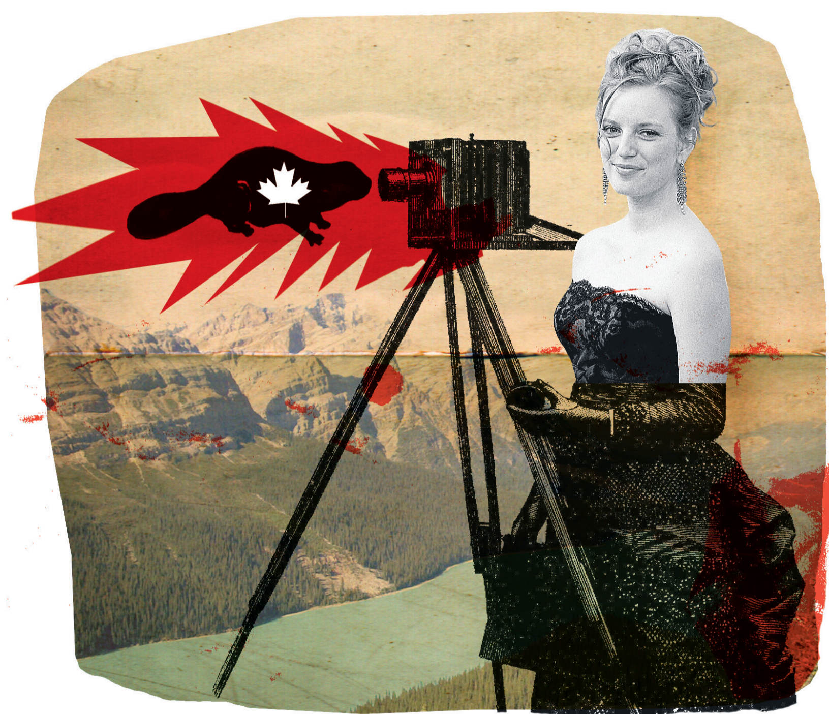
ILLUSTRATION FRANCIS LÉVEILLÉE, LA PRESSE