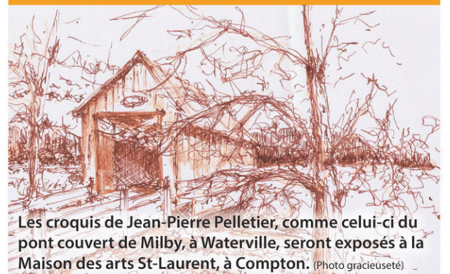
Les croquis de Jean-Pierre Pelletier, comme celui-ci du pont couvert de Milby, à Waterville, seront exposés à la Maison des arts St-Laurent, à Compton.

Il sera possible d'observer le projet « Tire-toi une chaise » jusqu'en octobre prochain, date à laquelle se tiendra le second Circuit des arts de Coaticook.