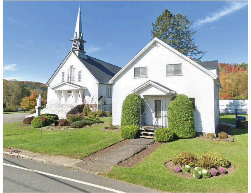
Le presbytère de l'église Saint-Henri, à East Hereford, sera transformé en logement abordable pour les travailleurs de la région.

de Saint-François, Geneviève Hébert. En plus d'accroître l'offre de logement, elle contribue à la rétention de la main-d'œuvre dans la région. Il s'agit d'un enjeu important pour East Hereford. »