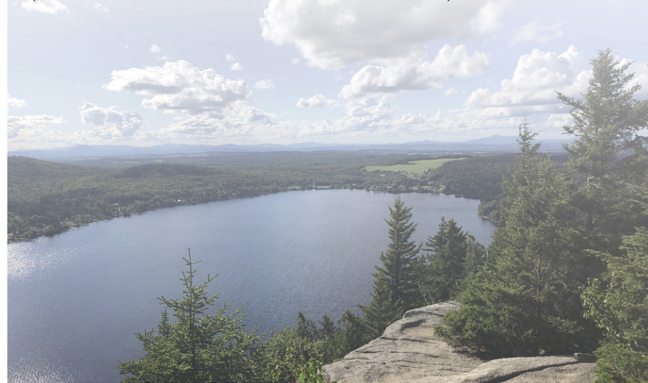
Le mont Pinacle est au cœur de la programmation été-automne du Parc Harold F. Baldwin.

Pour de plus amples informations, on peut consulter le site parchfbaldwin.com.