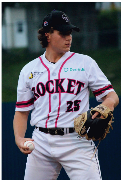
Le Rocket South Shore de Coaticook débute les séries éliminatoires ce mercredi (23 août).