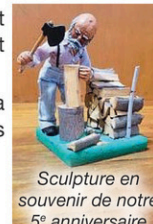
Sculpture en souvenir de notre 5 e anniversaire

À la douce mémoire de Maurice Chapdelaine décédé le 29 août 2018. « Demain et toujours, le souvenir d'un être cher trop tôt disparu restera gravé dans les cœurs et les yeux reverront sans pleurer la douce image du passé» Une messe 5 e anniversaire pour le repos de son âme sera célébrée le 27 août 2023 à 10h en l'église St-Thomas d'Aquin de Compton. Parents et amis sont invités à y assister. La famille