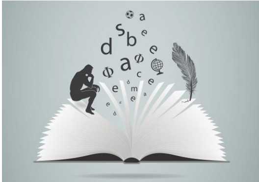
Table ronde – La formation générale au collégial : idéal dépassé ou éducation essentielle?

La Table de concertation de la formation générale vous invite à assister à une table ronde qui portera sur la question « La formation générale au collégial : idéal dépassé ou éducation essentielle? »