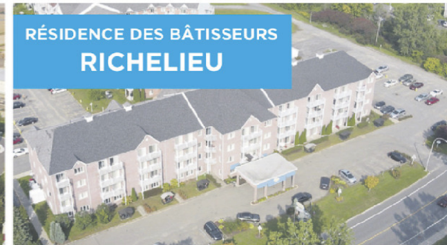
RÉSIDENCE DES BÂTISSEURS RICHELIEU

819 376-2114 800, Côte Richelieu, Trois-Rivières