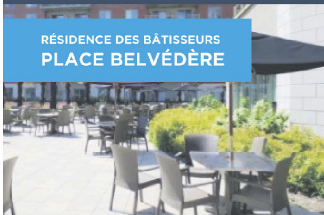
RÉSIDENCE DES BÂTISSEURS PLACE BELVÉDÈRE

PORTES OUVERTES SUR RENDEZ-VOUS PROFITEZ-EN POUR VISITER NOS APPARTEMENTS MODÈLES!