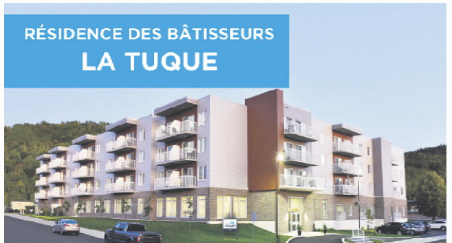
RÉSIDENCE DES BÂTISSEURS LA TUQUE

819 601-2331 • 1805, boul. des Forges, Trois-Rivières