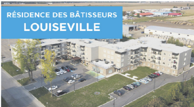
RÉSIDENCE DES BÂTISSEURS LOUISEVILLE

819 244-4009 211, 9 e Avenue, Louiseville