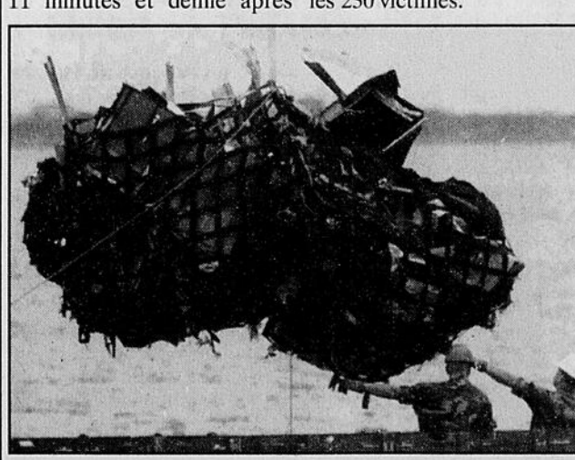
Une grue hisse dans une barge de nouvelles pièces du Boeing de la TWA, qui ont été récupérées hier.

Les autorités ont par ailleurs annoncé qu'un corps avait été retrouvé dimanche, ce qui porte le total de corps arrachés à la mer à 199 sur les 230 victimes.