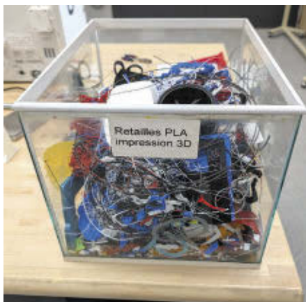
Rejets d'impression 3D

Depuis le 1 er mai, Matière a franchi une étape importante de son développement en s'installant à Saint-Flavien. Ce nouveau site regroupe désormais l'ensemble des opérations de l'entreprise, une expansion stratégique qui lui permet d'augmenter sa capacité de production, de traiter un plus grand volume de plastique avec des équipements à la fine pointe de la technologie. Cette relocalisation marque un tournant dans la croissance de l'entreprise.