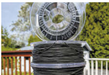
Bobines de plastique recyclé

C'est précisément là que Matière intervient en recyclant 100 % des déchets issues de l'impression. L'entreprise récupère ces résidus plastiques et les transforme entièrement en nouveaux filaments, la matière première essentielle à toute impression 3D. Les déchets sont d'abord réduits en petites granules, puis chauffés dans une extrudeuse. Le plastique est ensuite étiré, refroidi et enroulé sur des bobines prêtes à être réutilisées.