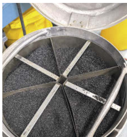
Séchage de la matière brute

Pour faciliter l'accès à ses services, Matière a également mis en place un réseau de points de dépôt en partenariat avec différents acteurs. Cette initiative facilite la récupération des déchets plastiques auprès des citoyens, des écoles et des entreprises, renforçant ainsi l'engagement collectif envers des pratiques plus écoresponsables. La liste de ces lieux est accessible sur la page Facebook de Matière.