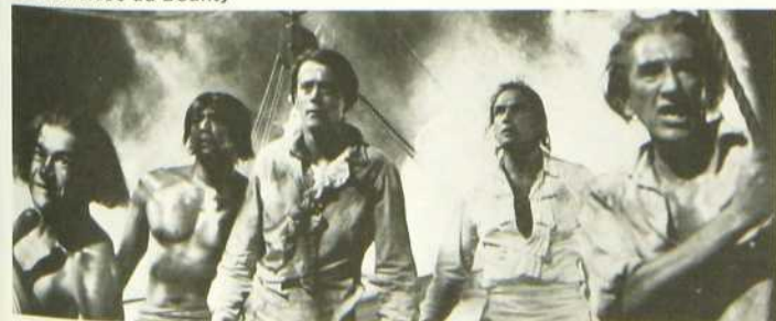
Les Révoltés du Bounty

Bref, un film d'aventures traité avec brio et intelligence où Marlon Brando est très à l'aise dans le rôle du jeune snob, bon marin, tout d'abord dédaigneux, lointain et qui, peu à peu, est saisi par la pitié et la nécessité d'agir.