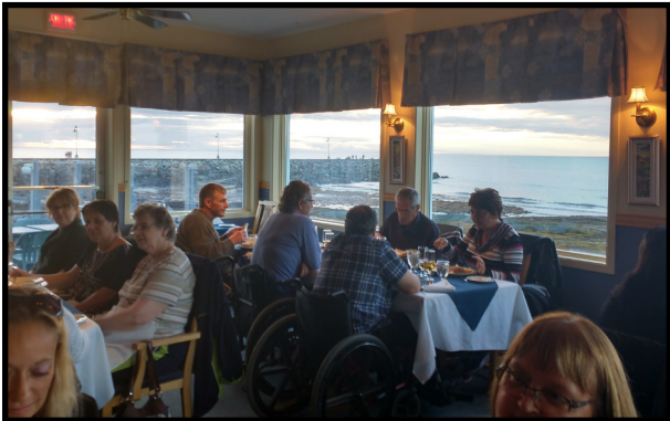
Un petit groupe de personnes vivant avec une lésion médullaire se sont rassemblées lors du souper à Sainte-Flavie