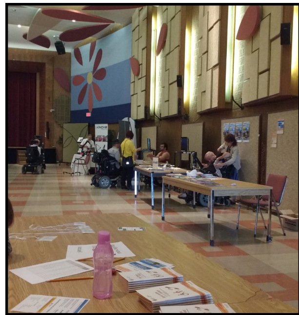
Plusieurs partenaires ont présenté leurs services lors du Salon du voyage accessible

La deuxième édition du salon du voyage accessible à l'IRDPO qui s'est tenu le 17 septembre dernier fut une belle opportunité pour nos membres d'en apprendre davantage sur les différentes possibilités s'offrant à eux pour voyager. Les participants ont fortement apprécié les présentations de nos partenaires présents à l'évènement. En plus des différents sujets abordés durant le salon tel que les croisières accessibles et les parcs nationaux accessibles au Québec, les visiteurs pouvaient échanger avec des membres sur leurs différents voyages à travers le monde. Ainsi, le salon a permis à nos membres de réaliser qu'il est possible de voyager malgré un handicap.