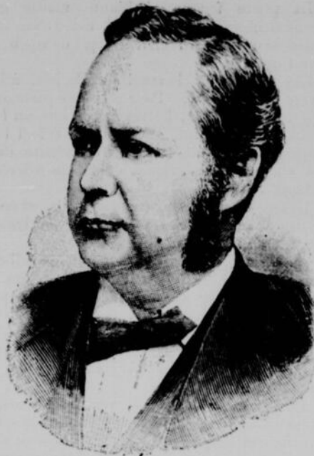
M. WINDOM, SECRÉTAIRE DU TRÉSOR

L'Hon. William Windom est mort subitement, jeudi soir, 29 janvier, à un banquet donné par la Chambre de Commerce de New York, dans l'hôtel Delmonico.