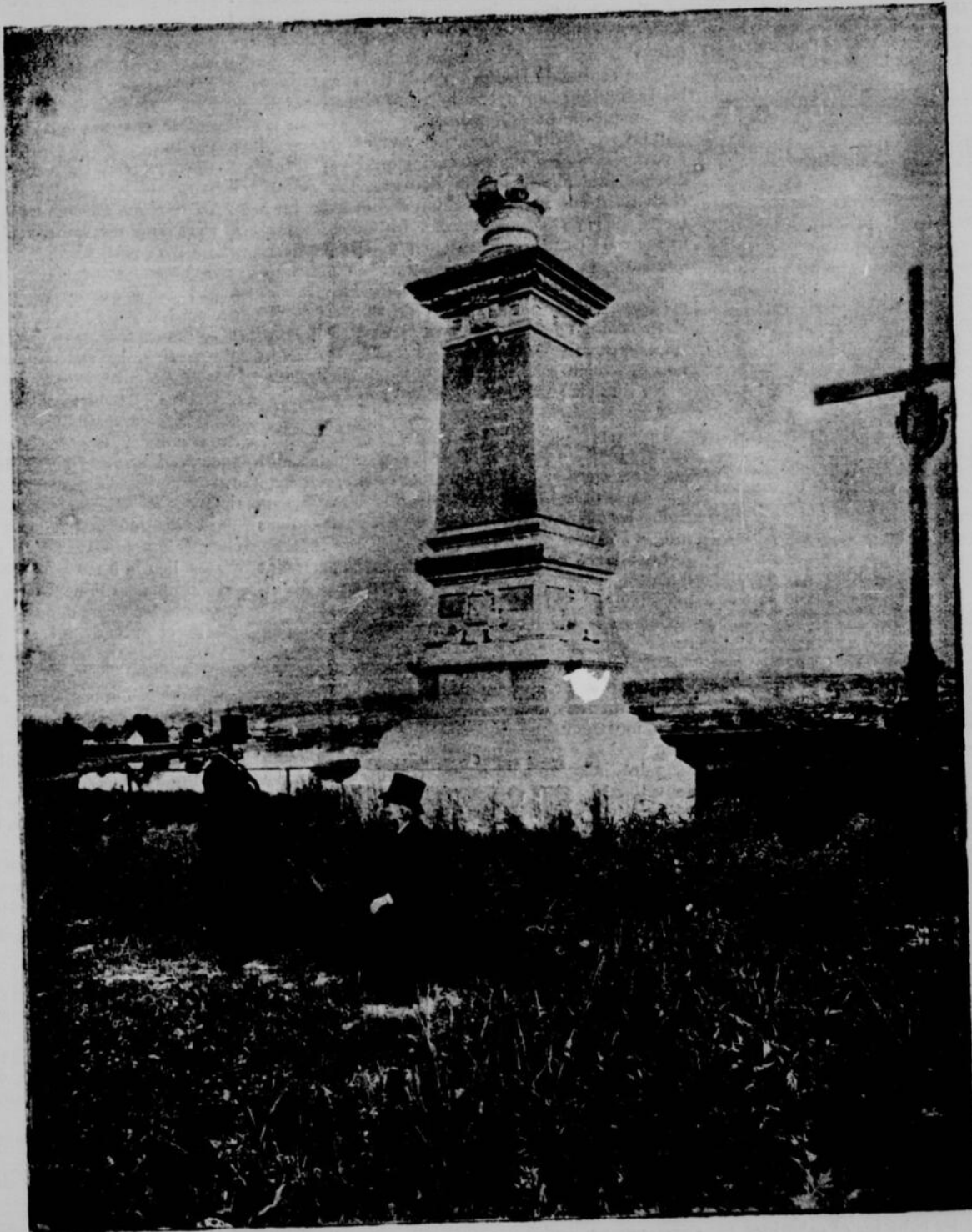
QUEBEC.—MONUMENT JACQUES CARTIER-BRÉBÉUF, ÉRIGÉ A QUÉBEC, LE 24 JUIN 1889, PAR LA SOCIÉTÉ SAINT JEAN-BAPTISTE

La ligne, par insertion - - - - 10 cents Insertions subséquentes - - - - 5 cents Tarif spécial pour annonces à long terme