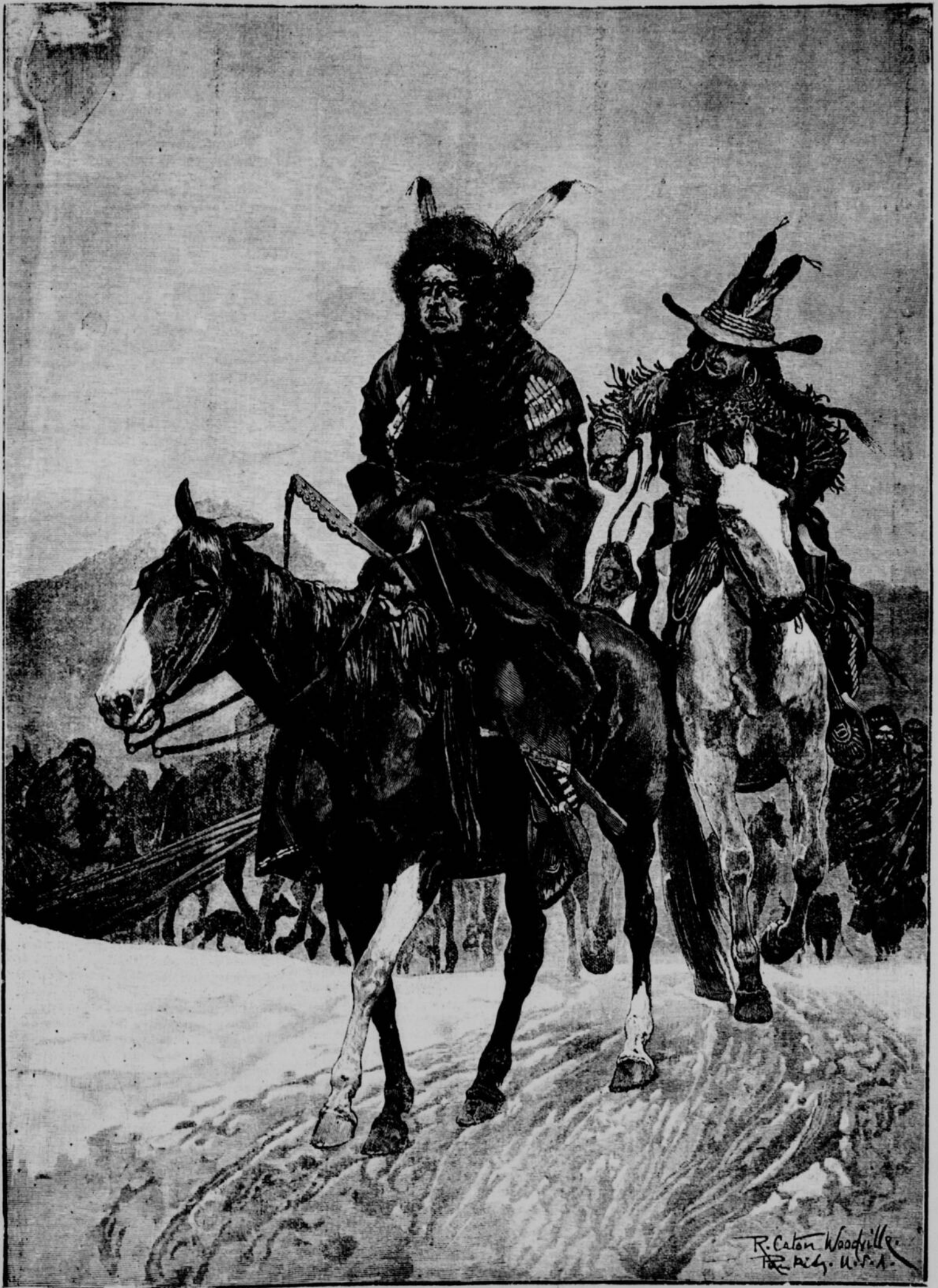
LE DENOUEMENT DE LA REVOLTE DES SAUVAGES. — INDIENS SE RENDANT A LA RÉSERVE FAIRE LEUR SOUMISSION