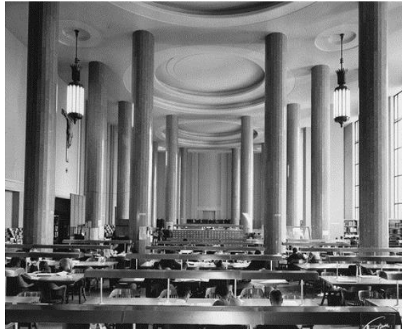
Salle de lecture de la bibliothèque centrale de l'Université de Montréal