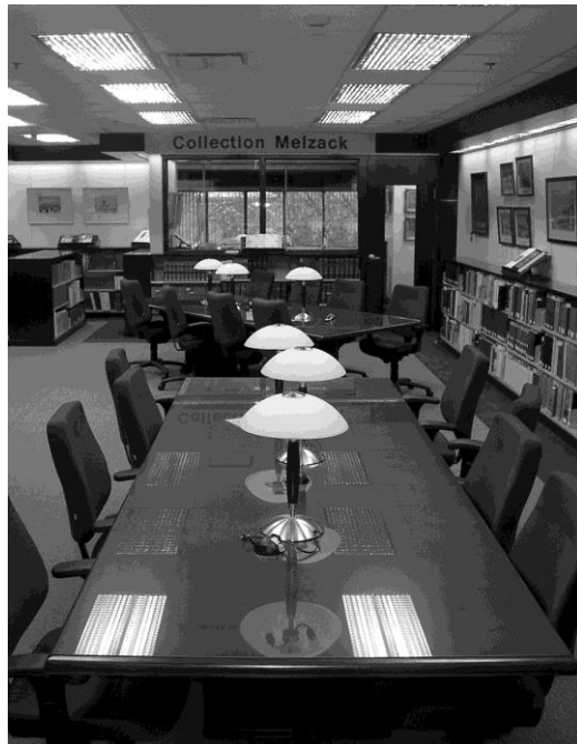
Salle de consultation principale inaugurée en 2004, BLRCS, UdeM.