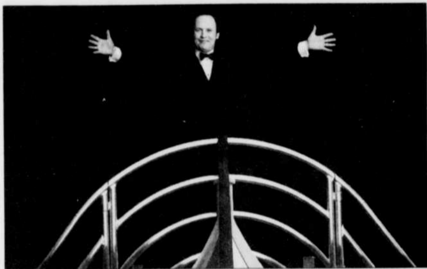
Billy Crystal à la proue d'une réplique du Titanic.

Pour fêter ce 70 e anniversaire des Oscars, la cérémonie s'était ouverte au son de la Fanfare pour Oscar , spécialement composée pour l'occasion.