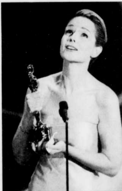
Helen Hunt, meilleure actrice

quête de tornades dans Twister . Sa performance dans As Good As It Gets la situe maintenant parmi les principales actrices américaines, une perspective qui ne semble pas l'inciter à quitter la télévision. Elle envisage au contraire de diriger trois épisodes de Mad About You .