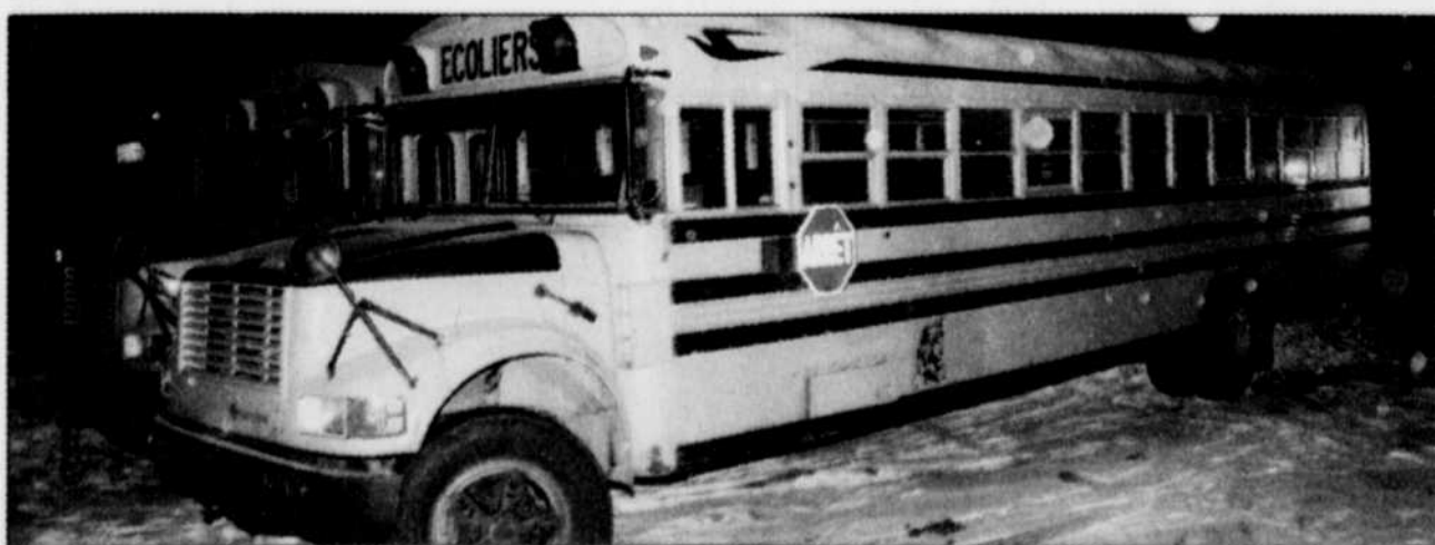
C'est dans l'autobus à l'avant-plan que la fillette a été retrouvée endormie.