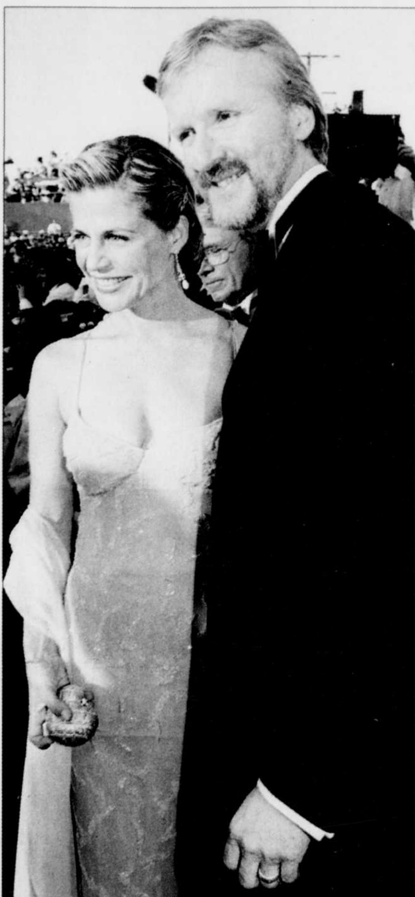
James Cameron et sa femme Linda Hamilton à leur arrivée à la cérémonie.