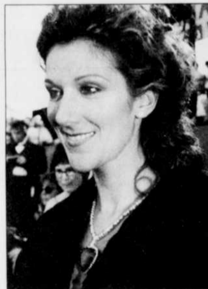
À son arrivée et pendant son interprétation de « My Heart Will Go On », Céline Dion portait le célèbre diamant bleu du film. Le bijou s'est vendu 2,2 millions $, la semaine dernière.

attendu a fait une brève apparition, un énorme ours baptisé Bart, héros de plusieurs films.