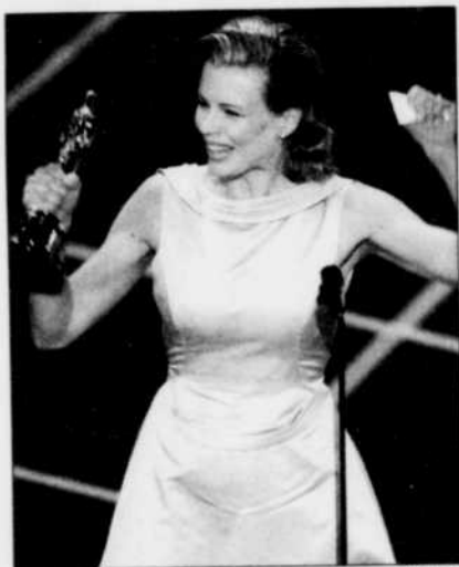
Kim Basinger jubilait... et pour cause.

Kim Basinger n'avait rien tourné depuis 1994 mais avec L.A. Confidential , les critiques ont pour une fois salué sa beauté et son talent. Ce film « a été une chance merveilleuse », dit-elle. « S'il m'apporte quelque chose, j'espère seulement que ce sera de meilleurs rôles. »