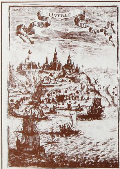
Bibliothèque Nationale du Québec