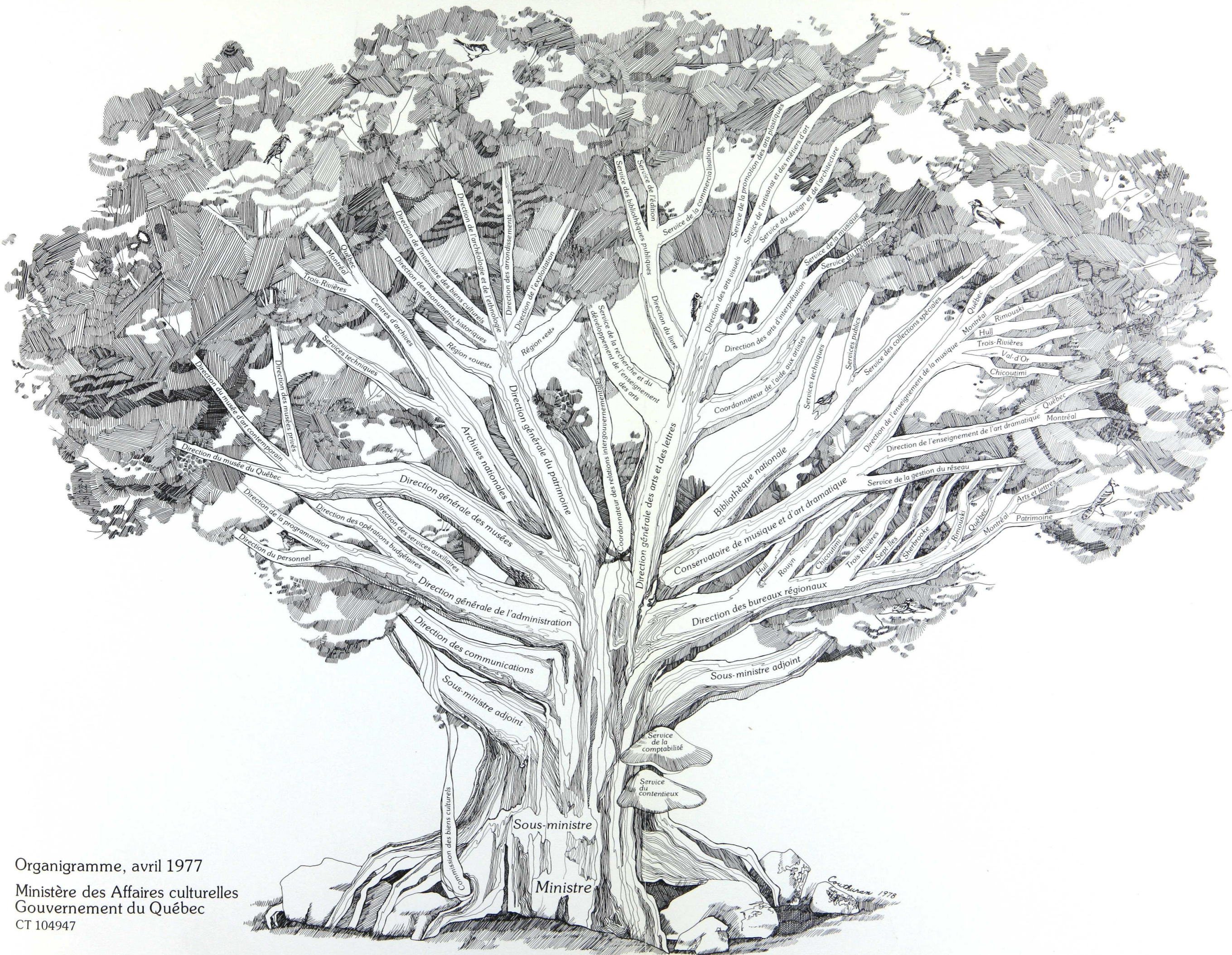
Organigramme, avril 1977 Ministère des Affaires culturelles Gouvernement du Québec CT 104947