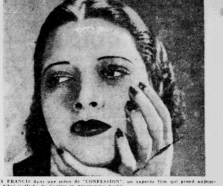
KAY FRANCIS dans une scène de "CONFESSION", un superbe film qui prend au jeu d'hui l'affiche du Cartier en programme double.