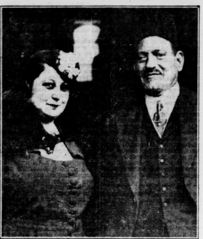
Le premier ministre d'Egypte, MUSTAPHA KEMAL, photographié ici avec sa femme, a échappé dernièrement à un attentat au Caire. Des membres des Cheikhs vertes, une association d'extrémistes nationalistes, ont été arrêtés à la suite du complot qui a échoué.