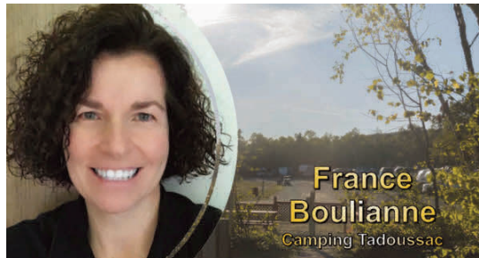
France Boulianne Camping Tadoussac