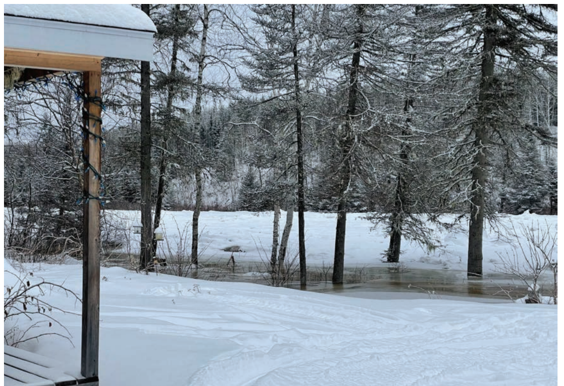
L'eau se fraie un chemin et approche le chalet de France Martel et Carl Tremblay de Longue-Rive.

et la fonte de la neige en raison du redoux, ont ainsi causé ces embâcles sur la rivière, emportant une dizaine de cabanes à pêche.