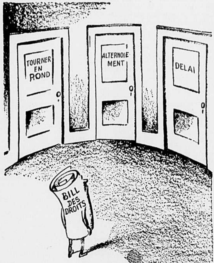
LA VOIE PENIBLE