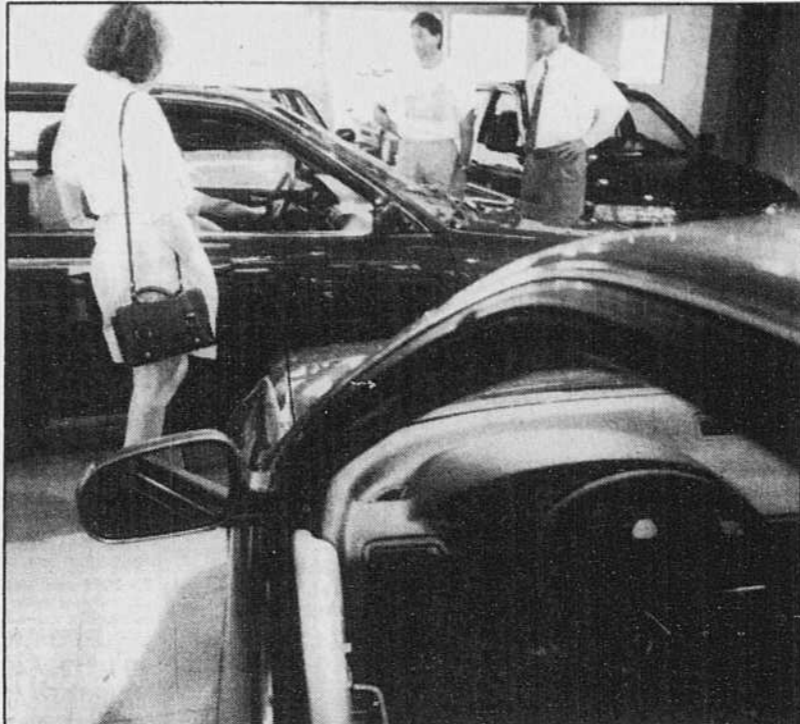
Un acheteur qui connaît le prix payé par le concessionnaire peut réaliser des économies pouvant aller jusqu'à 1000 $ par voiture.

Lorsque l'économie est florissante, les concessionnaires peuvent réclamer plus pour leurs véhicules, du