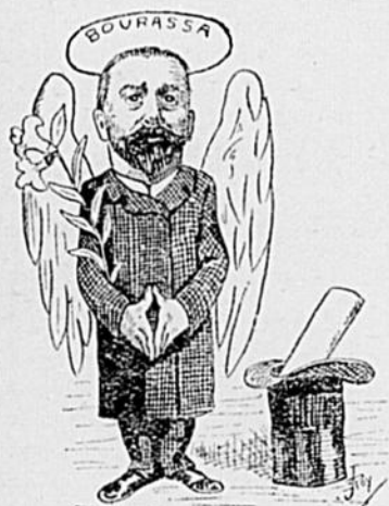
L'Ange de la Paix.

Un excellent remède pour vous guérir quand vous avez un grand mal "de dents". Il suffit de le mettre "dehors".