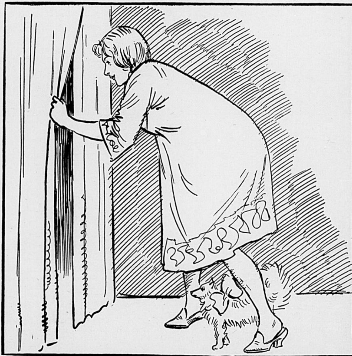
Cette jeune personne regarde le "Canard", qui est à se revêtir de sa nouvelle toilette de Pâques.