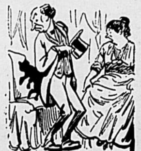
Le Monsieur, au chat. — Pardon, je ne vous voyais pas.