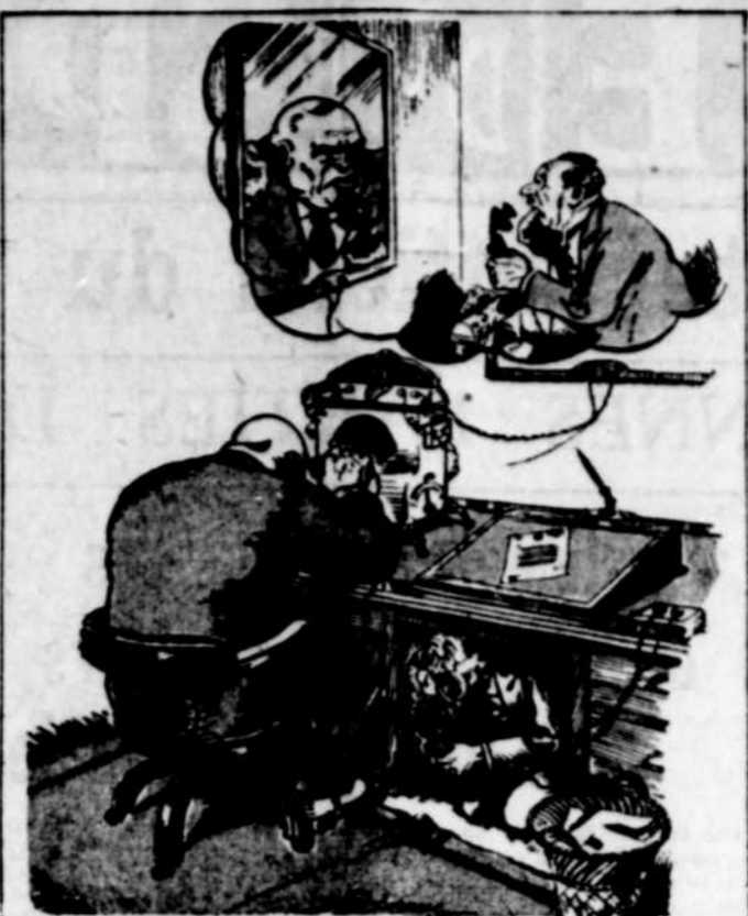
Une situation pour les anciens pugilistes lorsque la télévision sera en usage : le poste du garçon qui sera chargé de discuter.