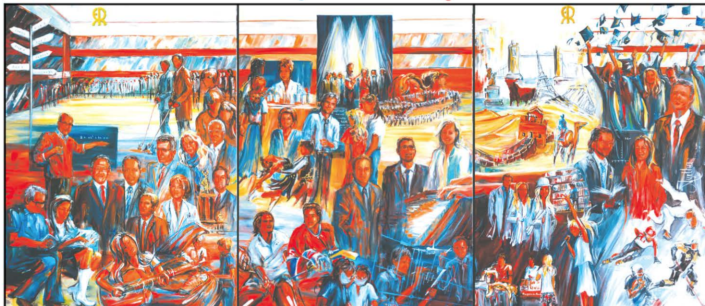
Le tableau se décline en trois sections par ordre chronologique.

Tant d'histoire habite l'école depuis 50 ans! Dans ce projet de fresque historique, sous le thème « 1968-2018 – De Mortagne, plus qu'une école », quelle meilleure façon qu'une fresque pour exprimer le vécu de ceux qui l'ont fréquentée! Six membres de ma famille y ont gradué! Que ce soit en guise de verbaliser l'effort, l'amitié, la réjouissance, la fraternité et l'expérience de vie en société qui s'y vit, il me fallait y illustrer un message positif: Les beaux souvenirs, l'attachement et la fierté éprouvée, mais surtout le succès qui résulte de l'effort, voire l'espoir pour ceux qui peuvent se décourager en parcourant. Je souhaite vraiment que cette fresque soit porteuse de message d'encouragement, d'apaisement,