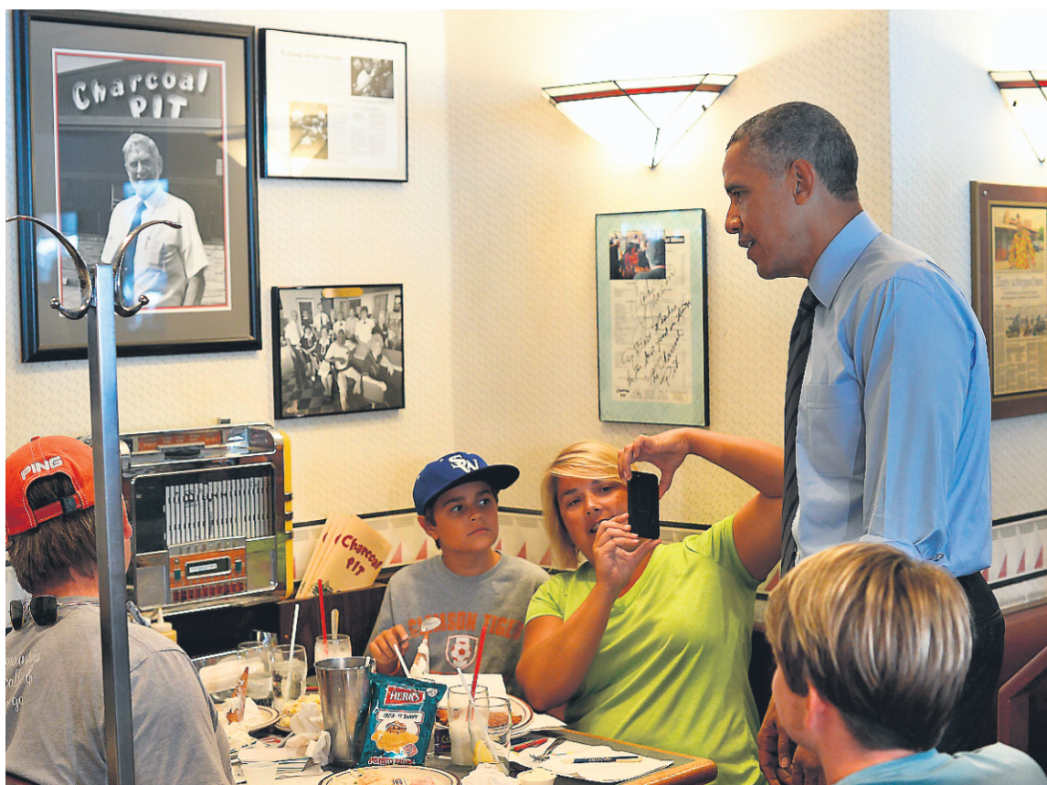
Le président américain Barack Obama s'est arrêté au Charcoal Pit le temps de casser la croûte avec des « citoyens ordinaires », et ce, après avoir été informé de l'écrasement du vol MH17 en Ukraine.

Après son allocution au Delaware, le président a poursuivi sa route vers New York, où il a participé en soirée à une activité de collecte de fonds pour le Parti démocrate.