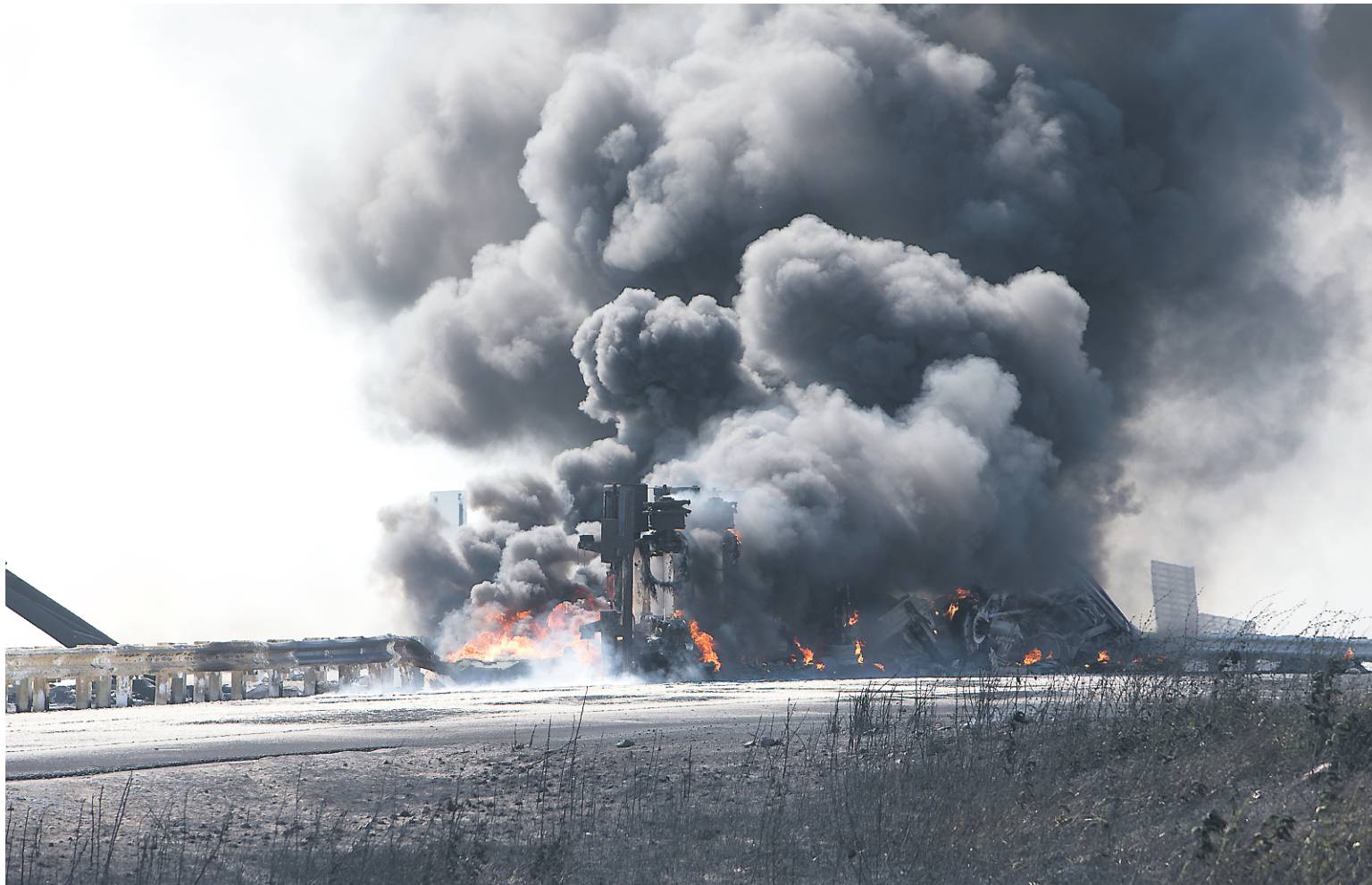
L'explosion d'un camion-citerne à la jonction des autoroutes 640 et 40, à Charlemagne, a causé la mort du conducteur du véhicule. Deux autres personnes ont été blessées dans l'accident.

Il s'agissait d'« une fourgonnette avec deux personnes à bord, qui ont été blessées de façon mineure », a indiqué Christine Coulombe, porte-parole de la Sûreté du Québec