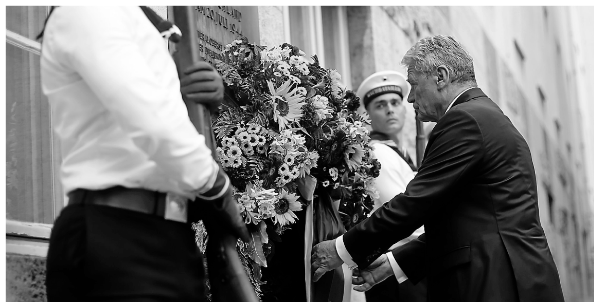
L'Allemagne a rendu hommage à un groupe d'officiers nazis qui ont tenté de tuer Adolf Hitler il y a 70 ans. Au cours d'une cérémonie modeste, hier, le président Joachim Gauck (photo) a décrit la tentative d'assassinat du 20 juillet 1944 comme « un jour important dans l'histoire allemande ». Hitler avait survécu à l'attentat à la bombe, et avait pu poursuivre sa campagne militaire pour conquérir l'Europe et éradiquer les Juifs du continent pendant encore un an.