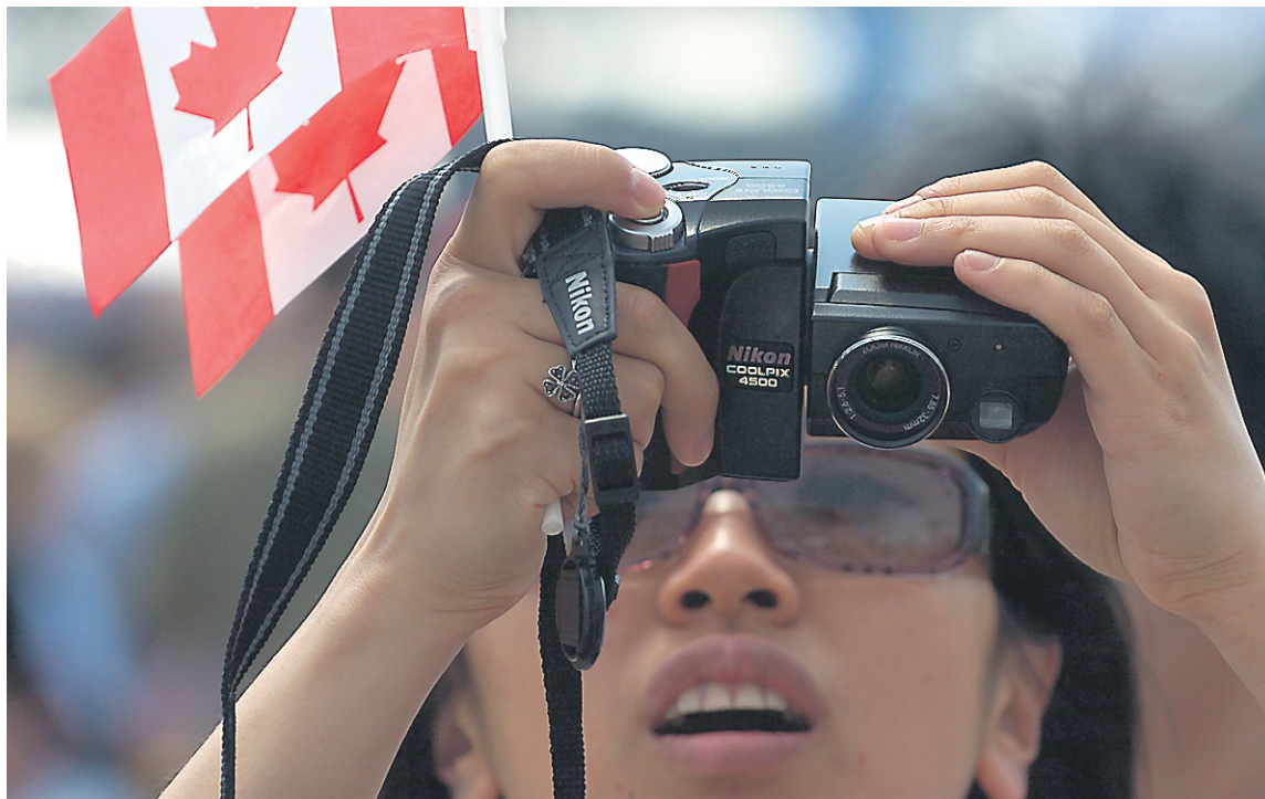
Selon les données de Citoyenneté et Immigration Canada, le nombre de demandes de citoyenneté a augmenté de 30 % depuis 2006. Pour l'année 2013, 333 860 demandes ont été envoyées.

Eileen a entamé ses démarches pour obtenir la citoyenneté canadienne en 2011. Les choses se sont corsées le jour où elle a reçu un questionnaire de résidence, en novembre 2012. Chaque année, ce questionnaire, destiné à lutter contre la fraude, est envoyé à plus de 20 % des demandeurs – ce qui rallonge le temps