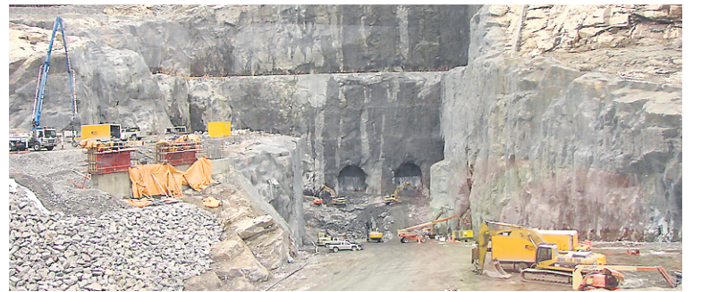
Chantier de la centrale de La Romaine-2, en novembre 2011.

de l'extérieur déjà implantées dans l'aquaculture», conclut le porte-parole, qui signale qu'un premier site pourrait être opérationnel d'ici 12 à 18 mois.