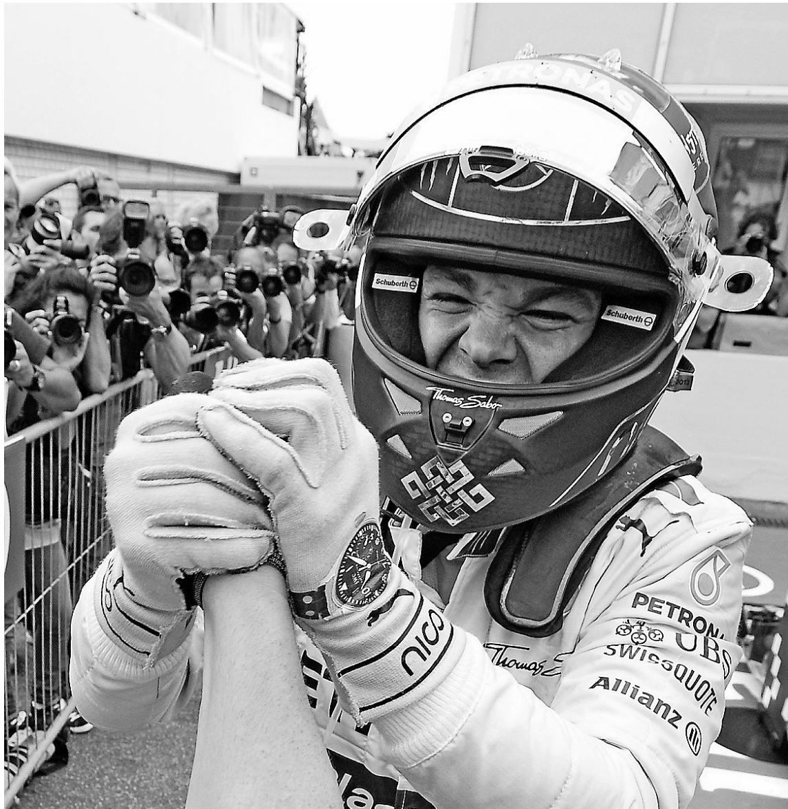
À Hockenheim, Nico Rosberg a remporté une quatrième victoire cette année, ce qui porte le total à neuf pour Mercedes en dix grands prix.

Les deux pilotes des Flèches d'argent, encore une fois au dessus du lot, ont été accompagnés sur le podium par le meilleur représentant, une fois de plus, de la nouvelle génération des pilotes de F1: le Finlandais Valtteri Bottas