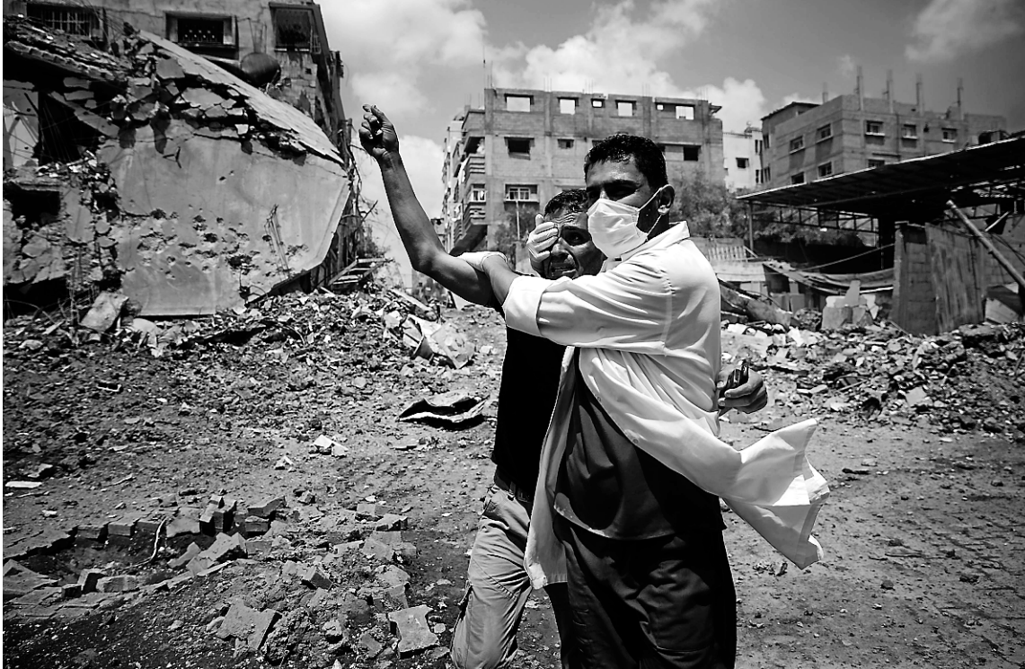
Le pilonnage de la ville de Chajaya, en banlieue de Gaza, par l'armée israélienne est le bombardement le plus meurtrier depuis la guerre de 2008-2009 dans l'enclave palestinienne.

Pour l'armée israélienne, la journée d'hier a été noire également: avec 13 soldats de la brigade d'élite Golani tués, le bilan des militaires morts dans l'offensive monte à 18, un nombre jamais vu depuis la guerre du Liban, en 2006. L'armée a aussi comptabilisé au moins 55 blessés.