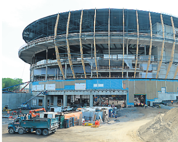
L'amphithéâtre de Québec en construction.

Ayant eu moi-même à vivre la maladie et ayant recouvré la santé grâce à l'action dévouée d'équipes de soins, vous comprendrez certes la haute estime que j'entretiens pour ces personnes. La santé n'a pas de prix. Et à titre personnel, je ne perçois pas dans les revendications des médecins un abus de pouvoir, mais plutôt un dialogue qui nous interpelle et nous questionne sur nos réelles priorités dans une société qui consent à des sportifs des