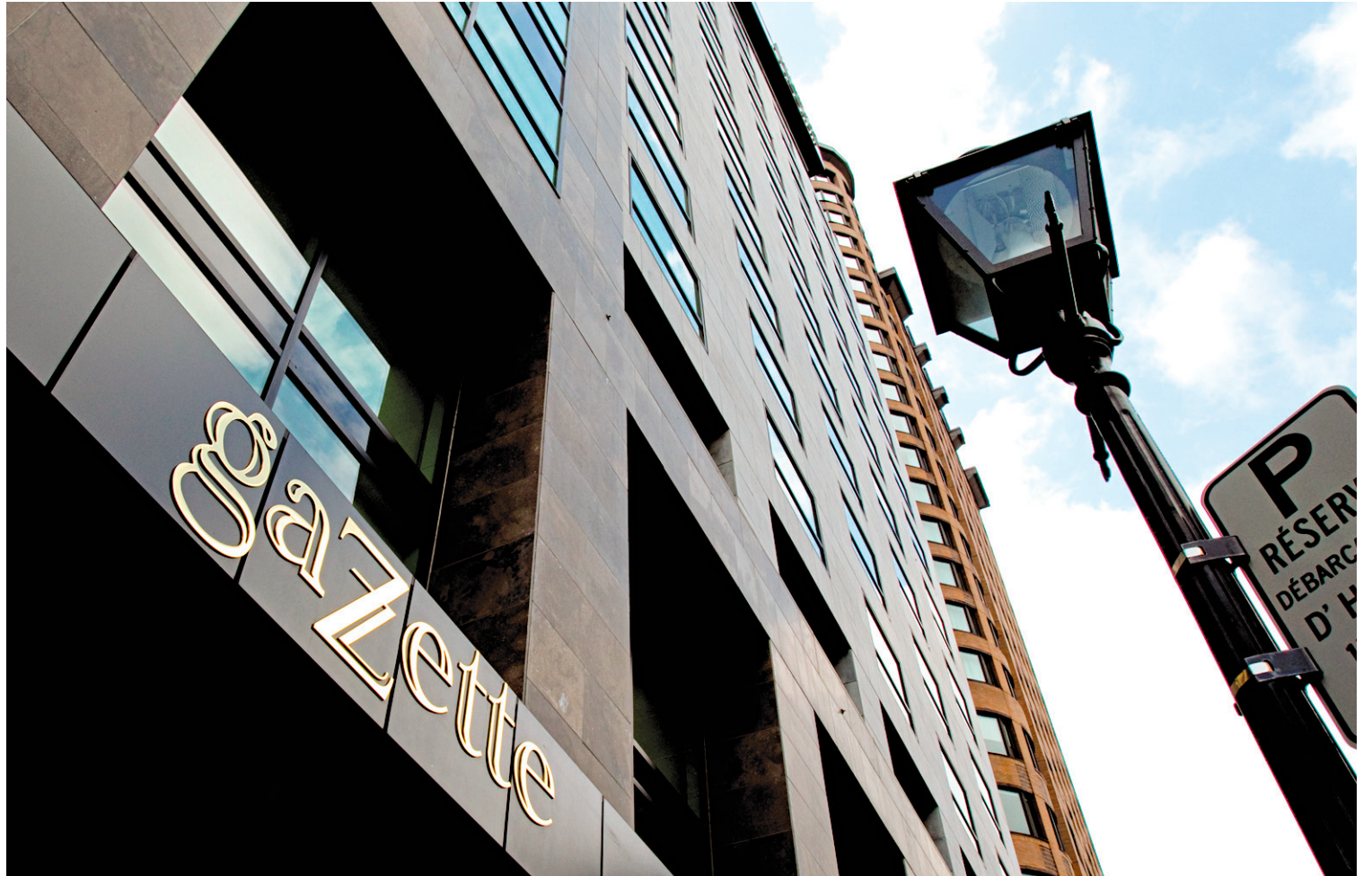
Les points en litige au lockout de The Gazette portent sur la dotation de personnel, les heures de travail et le paiement des heures supplémentaires.