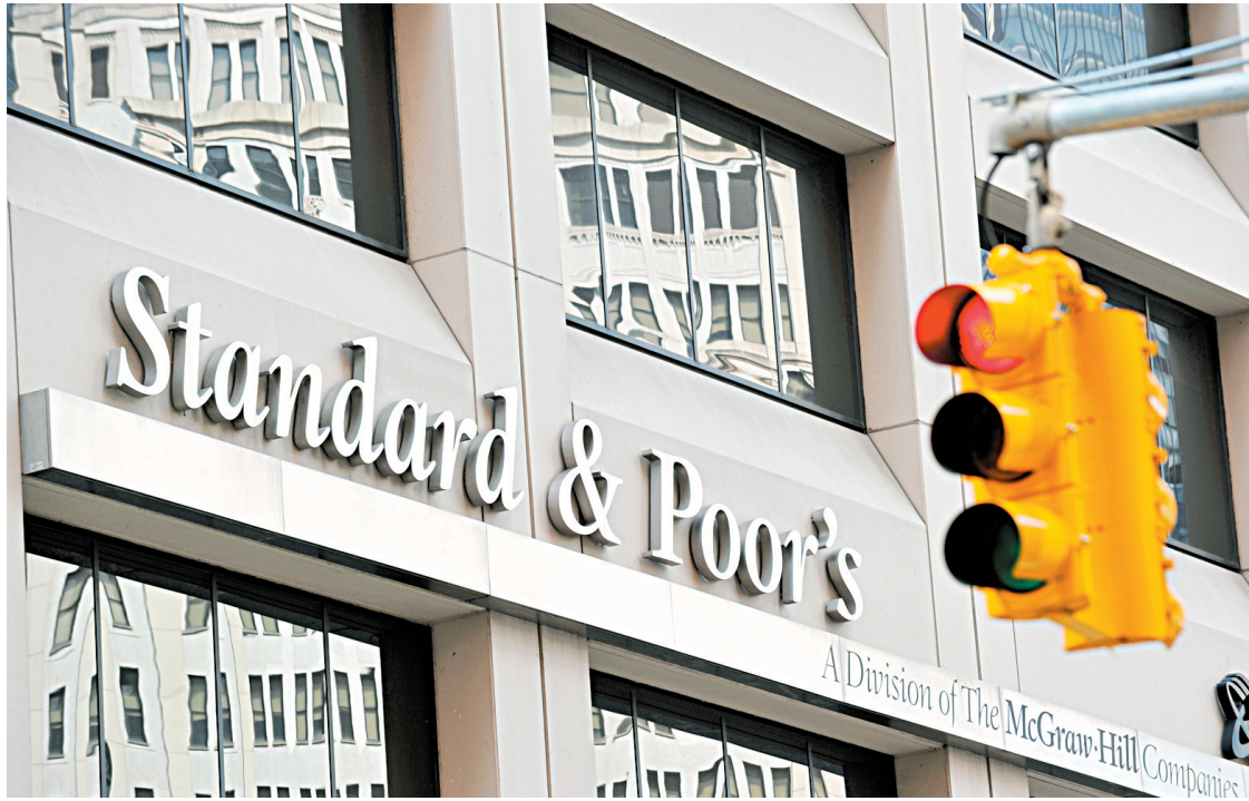
Un haut responsable de S&P défend l'agence de notation d'avoir fait une erreur de 2000 milliards, comme le clame le Trésor américain.

Il a aussi écarté les allégations du Trésor américain selon lesquelles l'analyse de l'agence de notation repose en partie sur une erreur de 2000 milliards de dollars. «Cette idée selon laquelle nous avons commis une erreur de 2000 milliards de dollars est