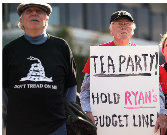
Aux États-Unis, des mouvements extrémistes comme le Tea Party bloquent le processus politique.