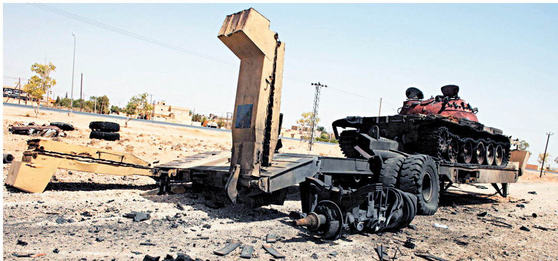
L'OTAN a effectué des raids à Bir al Ghanam.

La Havane — Cuba entame aujourd'hui les célébrations de l'anniversaire du «père de la Révolution» Fidel Castro, qui aura 85 ans samedi et dont la présence aux cérémonies et hommages n'a pour l'instant pas été confirmée. Les festivités culmineront dans la nuit de vendredi à samedi avec une sérenade à la fidélité, offerte au Lider maximo dans le théâtre Karl Marx, le plus grand de Cuba, qui peut accueillir jusqu'à 5000 personnes. Dès ce soir, un concert «Toutes les Voix» sera donné à La Havane. Ces célébrations coïncident avec le carnaval de La Havane, au cours duquel des défilés de chars sont prévus tous les soirs de la semaine jusqu'au week-end. Écarté du pouvoir depuis juillet 2006 pour raisons de santé, Fidel Castro limite au maximum ses apparitions publiques.