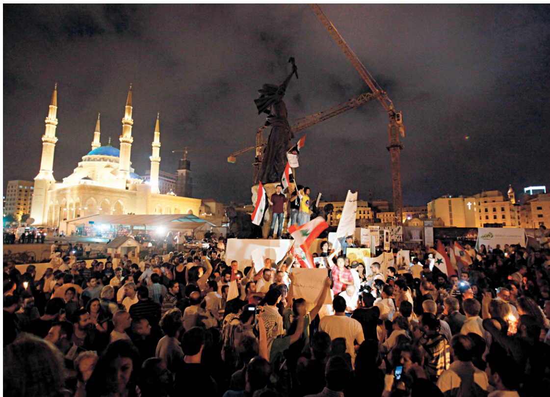
Des Libanais ont manifesté hier à Beyrouth pour appuyer la contestation en Syrie.

Dans une nouvelle tentative de convaincre le pouvoir de cesser la répression, le chef de la diplomatie turque, Ahmet Davutoglu, est attendu aujourd'hui à Damas pour adresser un message fort aux autorités. La secrétaire d'Etat américaine Hillary Clinton lui a demandé de leur dire de «renvoyer les soldats dans leurs casernes». Mais la tâche du ministre turc semble ardue, le régime refu-