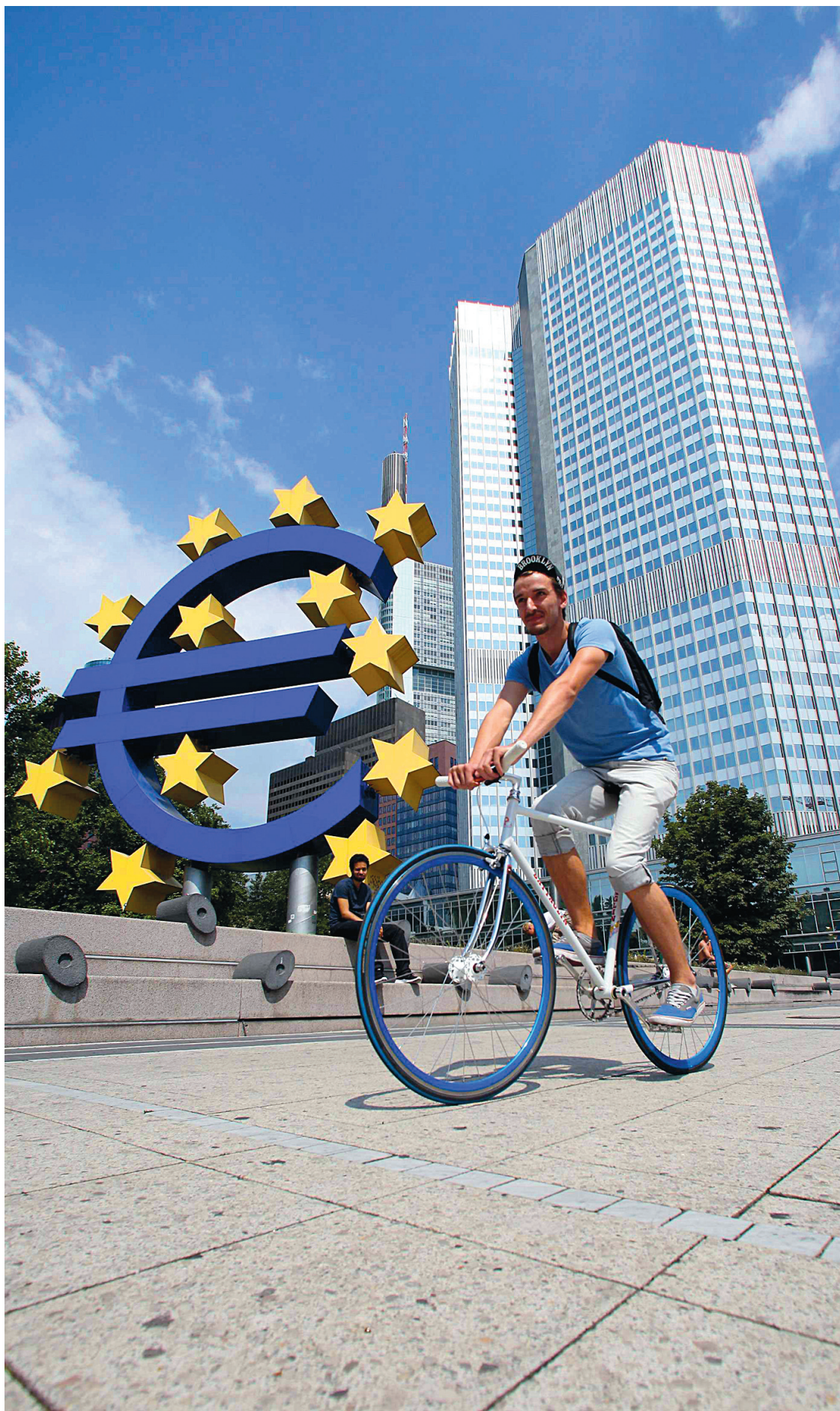
La BCE a élargi son programme de rachat à l'Italie et l'Espagne, les troisième et quatrième économies de la zone euro, désormais entrées dans le tourbillon de la crise de la dette.