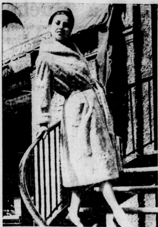
Haute nouveauté en fourrure : du rat musqué rasé teint lilas léger ! Une création de Michel, de Hollinger, comme manteau du soir qui peut aussi se porter le jour.