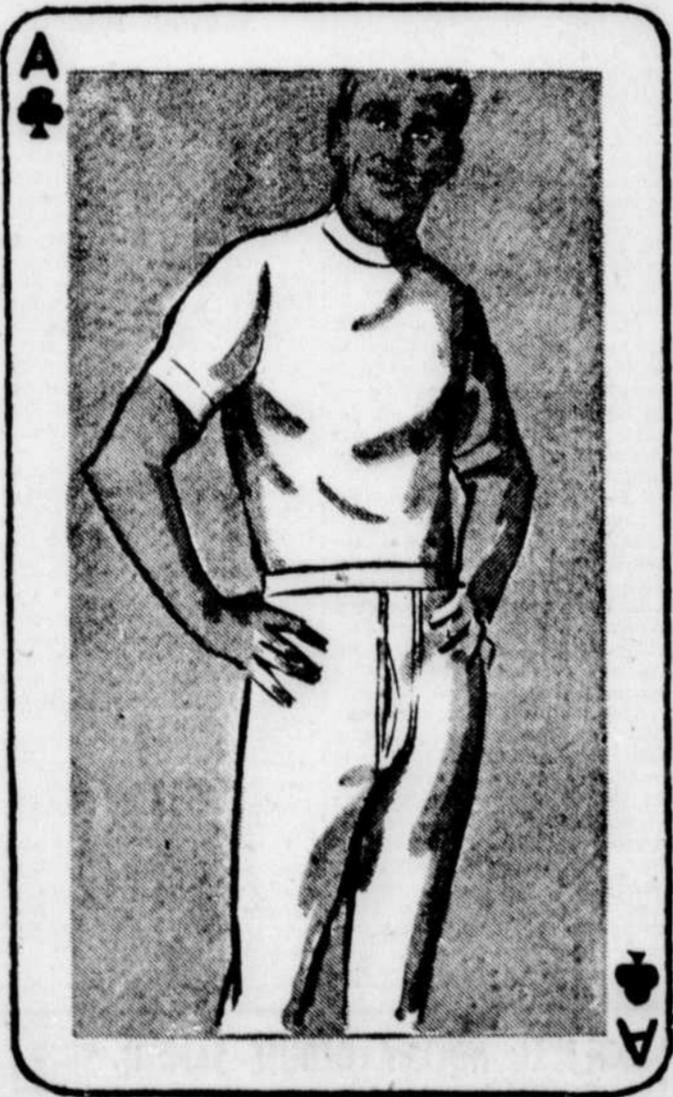
Tricot coton Interlock blanc Marque Windsor Wear appréciée