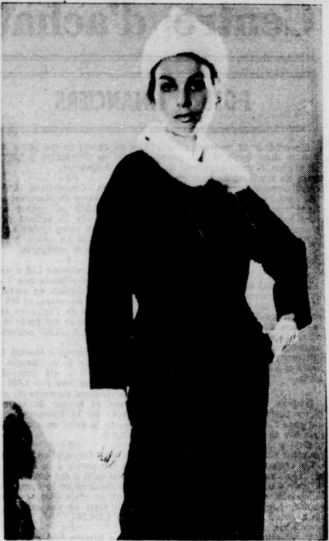
C'est du vison kohinor qui réchauffe ce petit tailleur d'automne en croisé de laine noir. La toque, jeune et amusante, est aussi de vison. La jaquette ne couvre que la moitié des hanches. C'est un modèle que l'on peut voir aujourd'hui, dans les nouvelles collections de la maison Dupuis Frères, en revue au théâtre Saint-Denis.

vouloir décrire les tissus nouveaux et de couleurs gais qui font des blouses, des vestes, des pantalons de sport droits ou en fuseaux, des jupes-culottes et des ensembles de lainages clairs qui accompagneront les randonnées sportives et les thés d'après-ski.