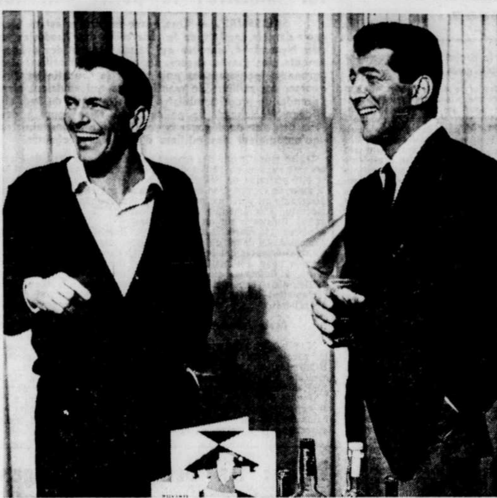
DEAN MARTIN et FRANK SINATRA dans une scène du film "Ocean's Eleven" qui prendra l'affiche du cinéma Loew's à compter de demain.