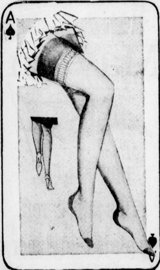
Fine couture foncée Haut-dentelle Qualité de 1.35 ord.

4 aubaines à ne pas manquer — 4 bas prix imbattables — 4 articles populaires VENEZ OU TÉLÉPHONEZ — VI. 2-6171