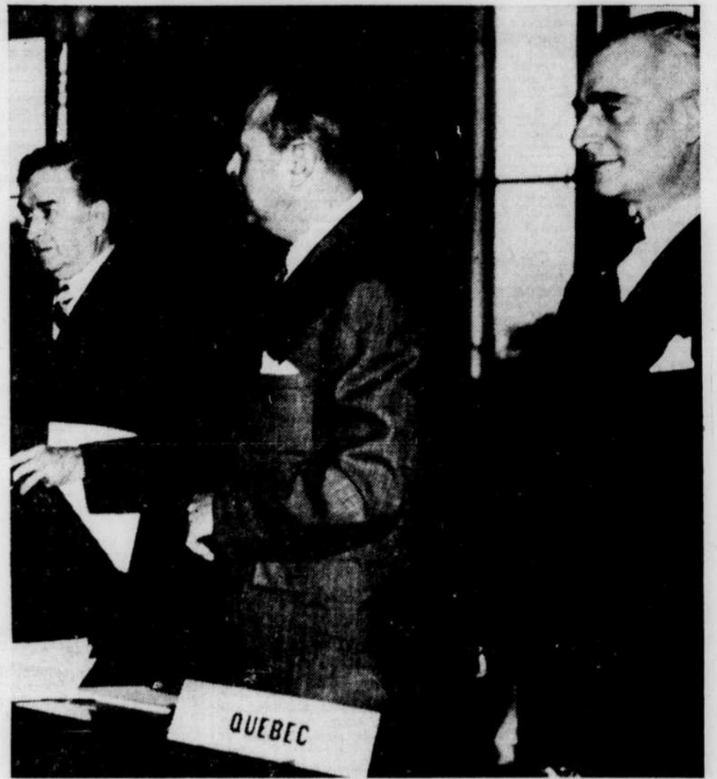
LES TROIS CHEFS DE L'UNION NATIONALE. — Sur cette photo historique apparaissent, par ordre de succession, les trois chefs de l'Union nationale depuis sa fondation: MM. Maurice Duplessis, Paul Sauvé et Antonio Barrette. Cette photo a été prise à Ottawa, le 25 septembre 1950, lors d'une conférence fiscale fédérale-provinciale.