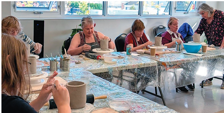
Le programme Entraid'âinés de Communautés Solidaires permet à plusieurs personnes âgées de pouvoir participer à diverses activités de loisirs.

Depuis 2018, l'organisme Communautés Solidaires déploie son programme Entraid'âinés qui lui permet de leur offrir des activités de loisirs, mais aussi des services de référence, d'accompagnement, de transport et de visites à domicile. En vertu de la Politique de reconnaissance des organismes à but non lucratif de la Ville, l'organisme reconnu s'est vu accorder un statut de proximité. De plus, la catégorie qui lui a été attribuée est celle d'associé. Il est logé gratuitement par la Ville dans un bâtiment municipal sur la