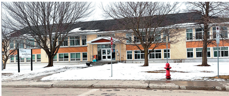
Le pavillon 2 sur la rue Savio.

Selon les informations obtenues par le journal, le début des travaux est prévu en avril et l'échéancier n'était pas encore connu pour la fin du chantier au moment d'aller sous presse. L'entrepreneur A.G.M. Construction sera en charge de la construction selon les plans conçus par la firme Brigad Architecture. Cet ajout sera aménagé sur deux étages dans la cour d'école entre les deux pavillons. Pouvant accueillir entre 20 et 26 élèves selon le niveau d'enseignement, ces huit nouvelles classes seront accessibles par les deux bâtiments. Plus de 453 élèves du préscolaire au troisième cycle fréquentent actuellement l'école aux Quatre-Vents dont les pavillons 1 et 2 sont situés sur les rues Savio et Tanguay dans l'ancien secteur de Villeneuve.