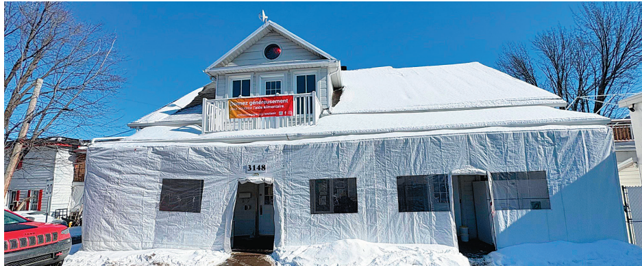
Entraide Agapè en profitera pour planifier sur 10 ans l'entretien de ses deux bâtiments sur le chemin Royal, la ressourcerie et la banque alimentaire.

Plus précisément, ce projet se déclinera en deux axes majeurs, soit de procéder à la définition des orientations pour le développement des services, la gestion des ressources humaines, la gouvernance associative et le modèle d'affaires en économie