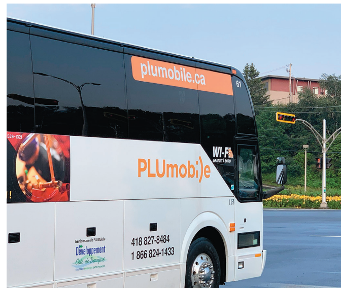
PLUmobile assure le transport collectif et adapté sur la Côte-de-Beaupré et à l'île d'Orléans.

Ce printemps, les travaux pour le tramway à Québec créent d'importantes entraves routières. Le parcours L'Express Sainte-Foy Hydro-Québec emprunte un nouveau tracé afin d'éviter les secteurs problématiques, depuis le 23 mars. L'autocar rejoint les cégeps Sainte-Foy et Garneau et l'Université Laval via le boulevard Hamel et l'autoroute Robert-Bourassa. Des nouveaux arrêts sont notamment installés à Place Fleur de Lys et à l'IRDQP.