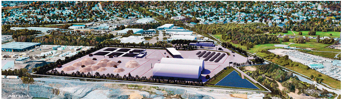
Perspective du futur centre de valorisation des surplus de matériaux d'excavation et de traitement des sols contaminés de la Ville de Québec.

Le projet bénéficie d'un soutien financier de 5 M $ du gouvernement du Québec, ainsi que d'une subvention de 1,5 M $ et d'un prêt de 10 M $ de la Fédération cana-