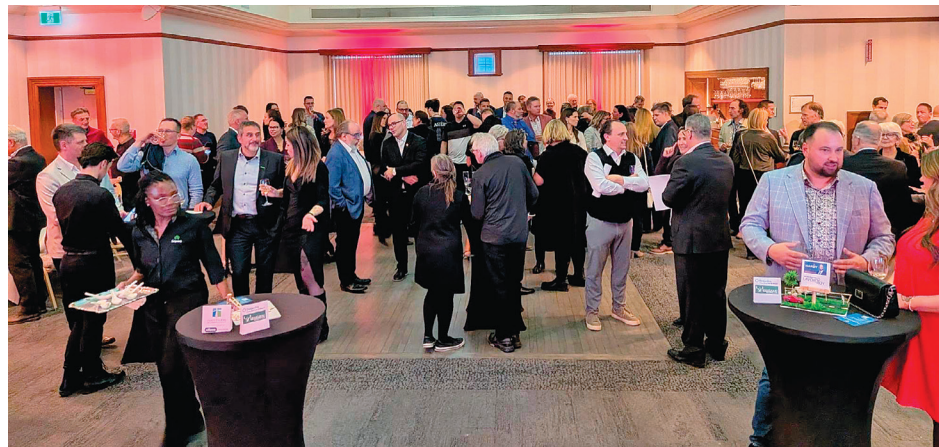
La 15 e édition du cocktail dînatoire a regroupé 140 participants au Manoir Montmorency.

Letarte, s'est dit impressionné par l'appui de la population pour cette institution d'enseignement secondaire privée de Saint-Tite-des-Caps.