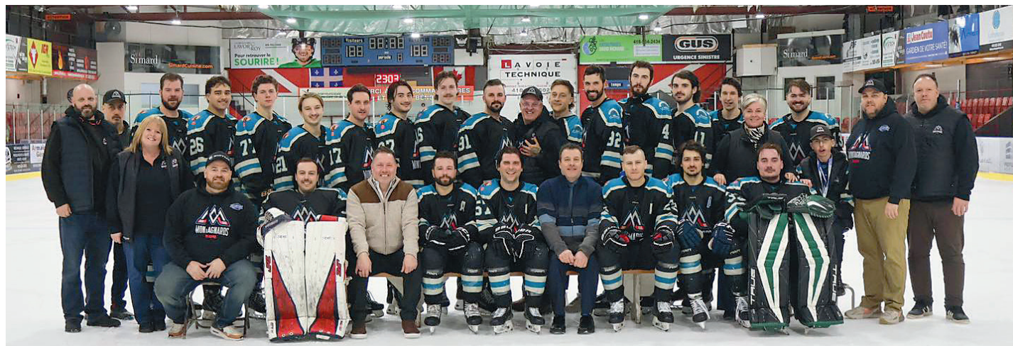
L'édition 2025-2026 des Montagnards de Beaupré.