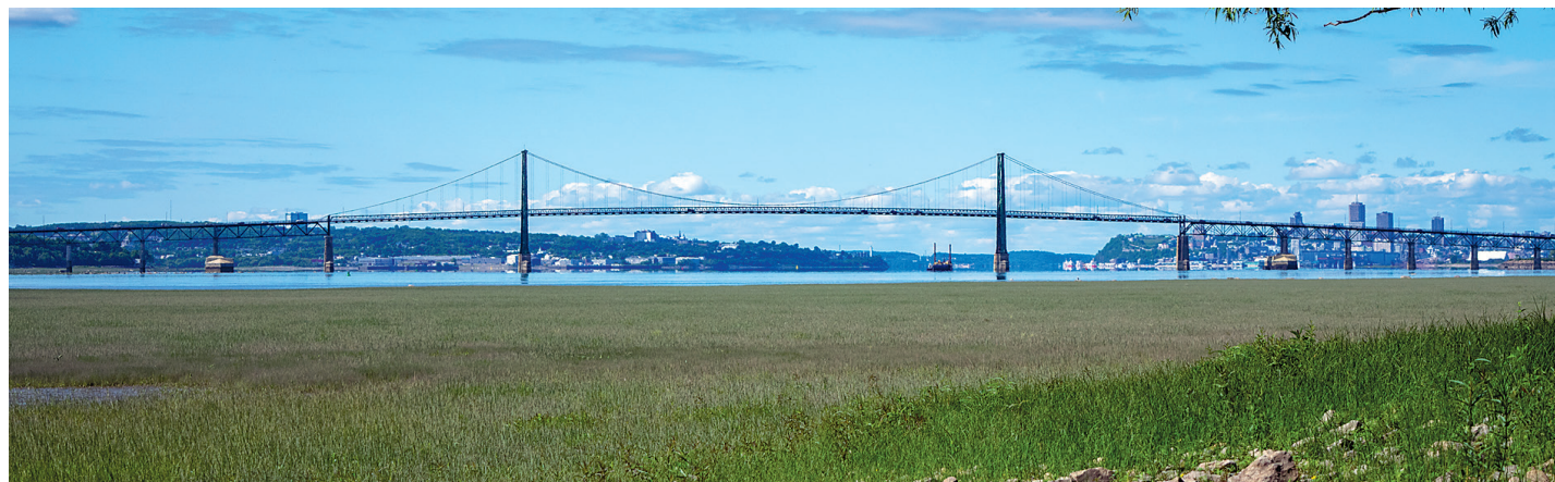
Implanté depuis 30 ans à Beauport, le G3E est le gardien depuis 2004 de la Zone importante pour la conservation des oiseaux des battures de Beauport et du chenal de l'Île d'Orléans (ZICO QC107).

Les inventaires réalisés ont dénombré 74 espèces végétales sur 114 hectares