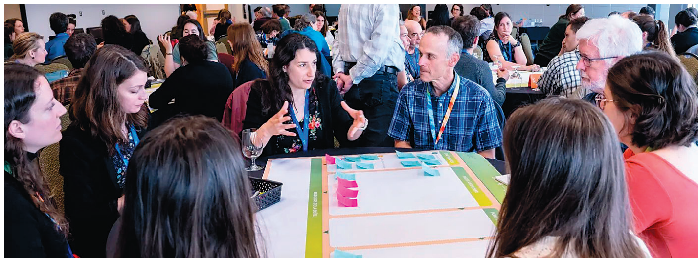
Ces ateliers visent à faire émerger des idées et des solutions adaptées aux réalités de chaque quartier.

Ces ateliers cherchent à réunir citoyennes et citoyens, organismes du milieu, ainsi qu'expertes et experts de l'agglomération de Québec afin de réfléchir collectivement aux défis sociaux et environnementaux vécus sur notre territoire. En misant sur l'intelligence collective, ces espaces de collaboration visent à faire émerger des idées et des solutions adaptées aux réalités de chaque quartier, permettant de favoriser l'engagement de la collectivité et l'adoption d'un mode de vie durable.