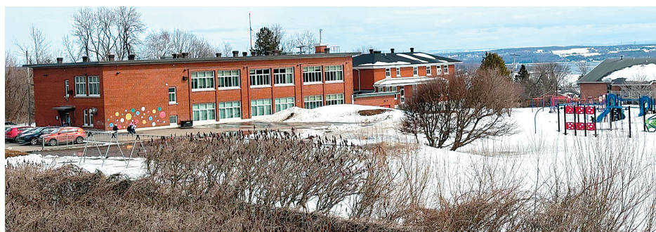
Vue de la cour arrière du pavillon 1.