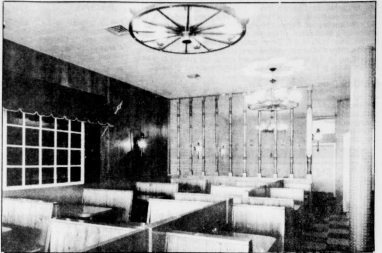
Les premiers clients du « Fiacre » se souviendront avec une certaine nostalgie de cet aménagement des années 60.