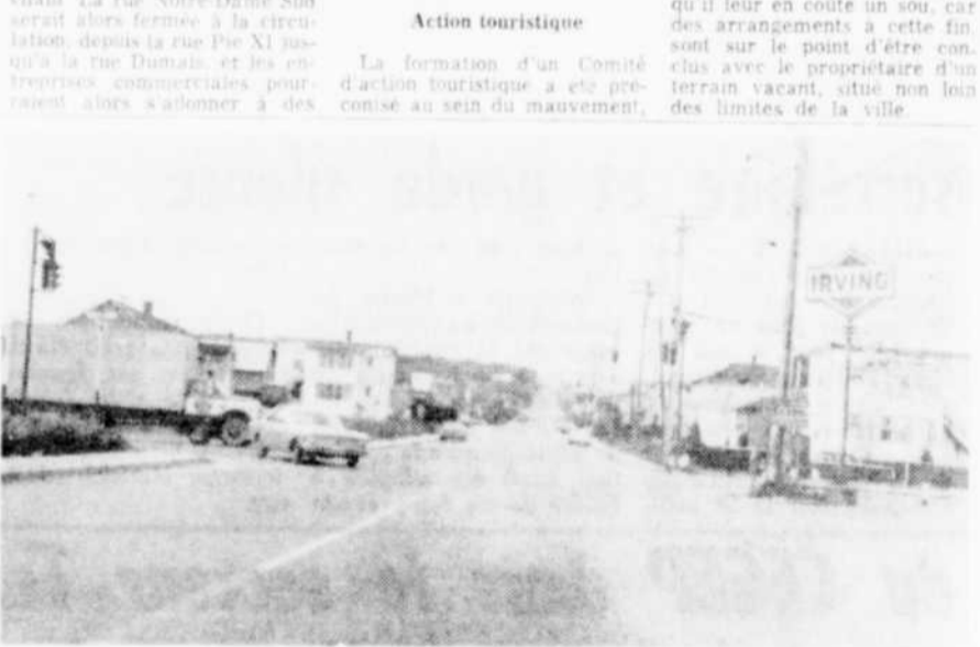
DES AMÉLIORATIONS S'IMPOSENT — L'état des lumières de circulation placées à l'intersection de la rue St-Alphonse Ouest et du boulevard Smith, à Thetford Mines, laisse à désirer depuis longtemps. Cette semaine, la Chambre de commerce locale s'est penchée sur ce problème, et elle entend faire les recommandations appropriées auprès des autorités responsables, pour obtenir les améliorations qui s'imposent à cette intersection des plus achalandées.