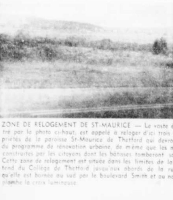
ZONE DE RELOGEMENT DE ST-MAURICE — Le vaste étendu de terrain vacant illustré par la photo ci-haut, est appelé à reloger d'ici trois ou quatre ans, toutes les propriétés de la paroisse St-Maurice de Thetford qui devront être démolies en vertu du programme de rénovation urbaine, de même que les nouvelles résidences qui seront construites par les citoyens dans les bâtisses tomberont sous le pic des démolisseurs. Cette zone de relogement est située dans les limites de la paroisse Ste-Martre. Elle s'étend du Collège de Thetford jusqu'aux abords de la rue St-Alphonse Ouest, tandis qu'elle est bornée au sud par le boulevard Smith et au nord par le 3ème rang, que surplombe la croix lumineuse.