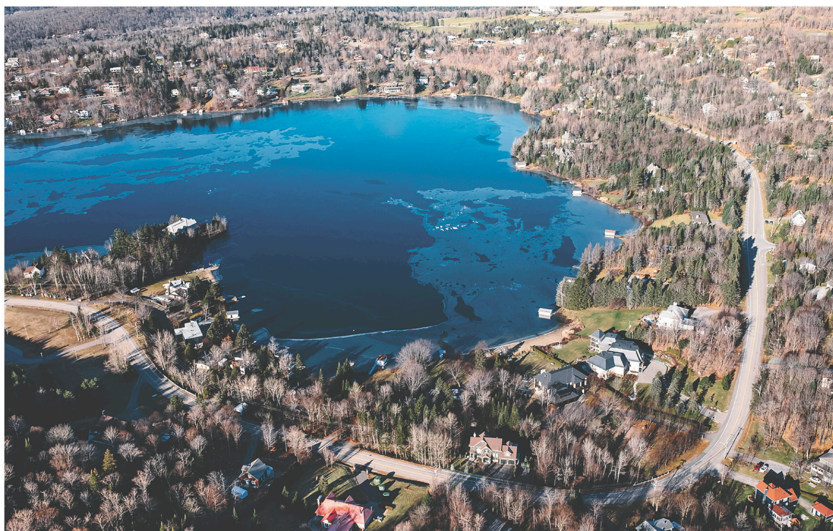
RENAUD PHILIPPE LE DEVOIR

Il y a une « forte présence de cyanobactéries » dans le lac, selon une étude réalisée à l'été 2013 par l'APEL.