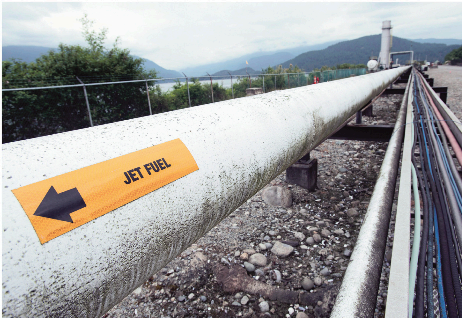
JONATHAN HAYWARD LA PRESSE CANADIENNE

Ce projet signifierait également une augmentation significative du trafic de pétroliers dans le secteur de Vancouver.