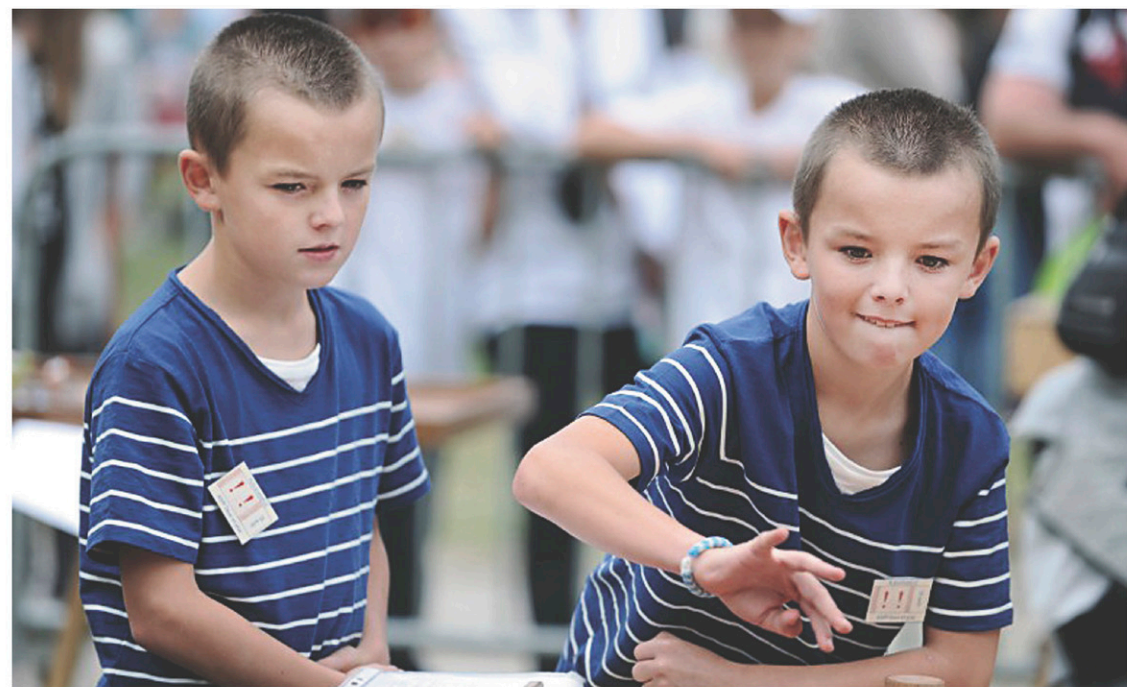
Des frères jumeaux lors d'une fête à Pleucadeuc, en France

Au Japon, l'effet de l'AMP est ainsi dix fois plus important que le retard des maternités. En Pologne, où l'AMP est encore peu développée, celle-ci ne joue que pour un tiers des naissances gémellaires. En Hongrie et en Nouvelle-Zélande, l'effet des maternités tardives et celui de l'AMP sont égaux.