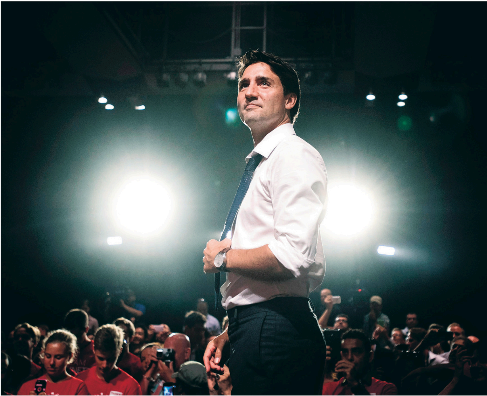
Les libéraux de Justin Trudeau écrasent leurs rivaux et relèguent le Nouveau Parti démocratique dans l'ombre.