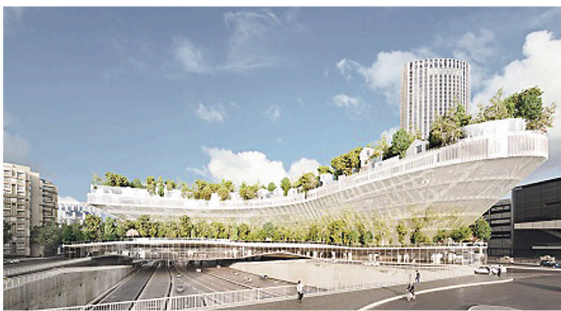
SOU FUJIMOTO/MANAL RACHDI-OKO/AFP

L'opération se veut tellement « innovante » que le commun des mortels n'est pas toujours certain de comprendre ce que les concepteurs entendent par « aquaponie », « habitat participatif », « biofaçades », « fermes urbaines », « espaces de co-fooding », « co-working », « co-living » ou « campings urbains ». Difficile de savoir pour l'instant s'il ne s'agit que d'un effet de mode.