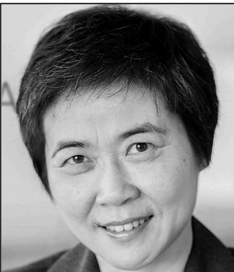
Fang Liu Secrétaire générale, Organisation de l'aviation civile internationale (OACI)