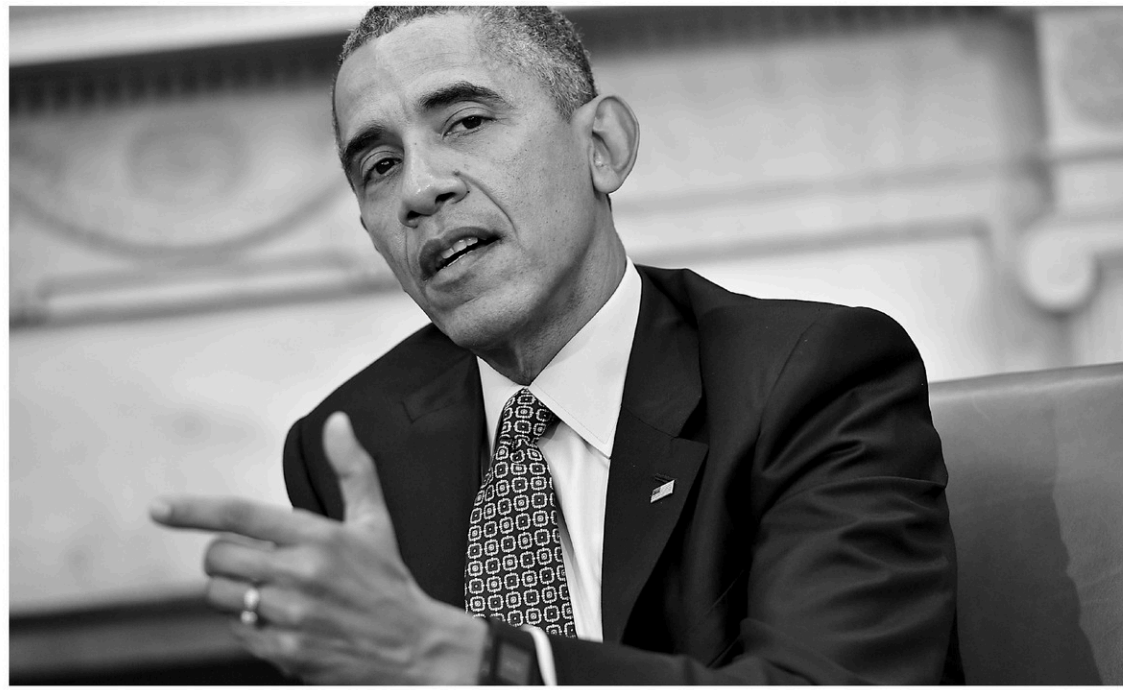
« La bonne nouvelle est que ce n'est pas comme Ebola, les gens ne meurent pas du Zika », a dit le président américain Barack Obama, lundi.