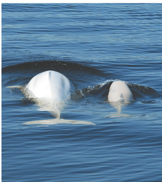
Les jeunes bélugas sont beaucoup plus nombreux que par le passé à être retrouvés morts.