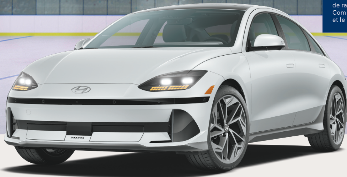
IONIQ 6 2025

de rabais sur les véhicules IONIQ 6 2025. Comprend le rabais additionnel de Hyundai et le rabais du gouvernement du Québec.*