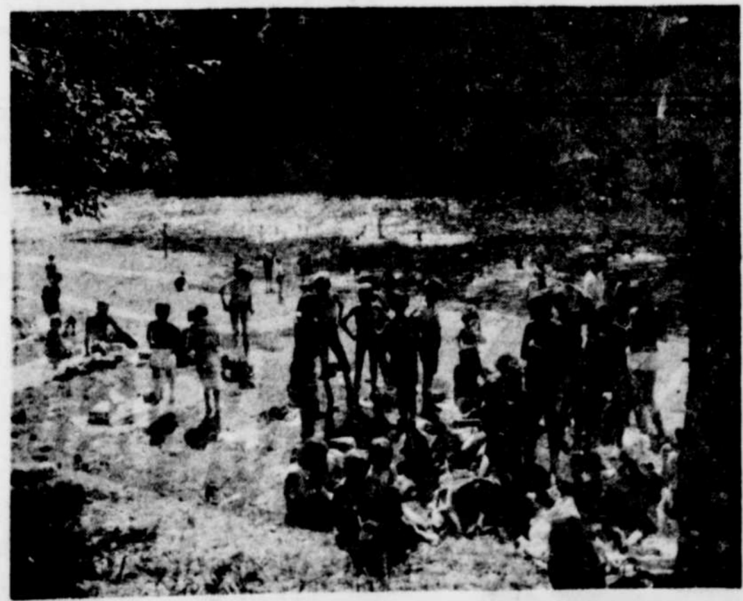
QUELQUE 800 JEUNES DES TERRAINS DE JEUX de Victoriaville se sont rendus jeudi après-midi au Cap d'Arthabaska, plage d'été située dans un décor enchanteur, avec montagnes escarpées, et eau courante. Sur notre photo, nous en voyons un certain nombre se baignant, et d'autres pique-niquant. Notons que le service de la récréation de la ville organisera à chaque mercredi après-midi de semblables excursions. XXX—ZXXM

La maternelle La presque totalité des jeunes admissibles à la maternelle sont inscrits pour 1967-68 à Princeville. Le nombre de ces jeunes est de 126. On procède actuellement à l'aménagement de deux classes qui s'ajouteront à celle où une quarantaine de débutants ont été reçus l'an dernier.