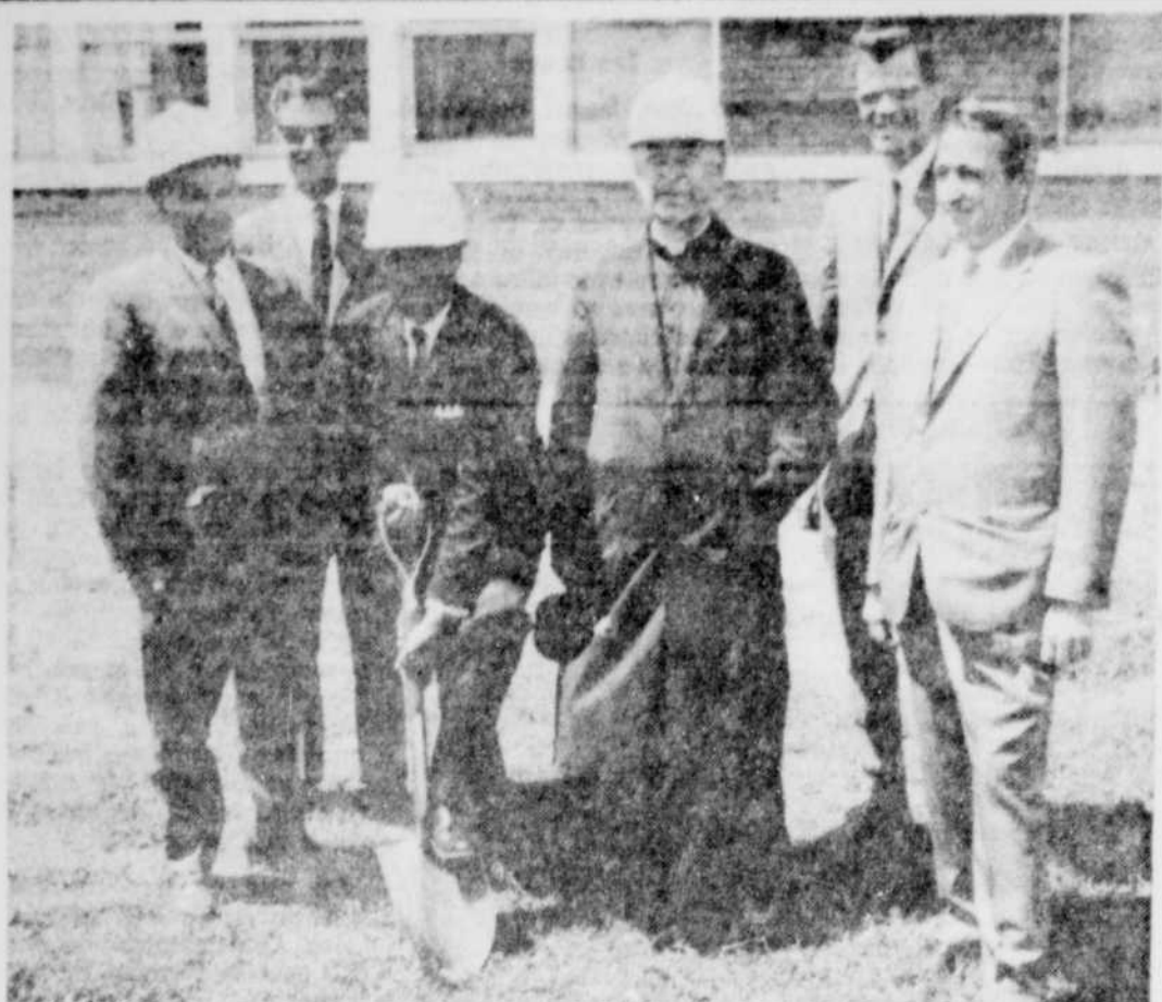
LECOLE POUR GARÇONS DU VILLAGE DE St-Cyrille de Wendover, comptera 15,000 pieds de plancher de plus, comprenant six nouvelles classes, dès novembre prochain. La levée de la première pelletée de terre a eu lieu jeudi après-midi en présence du curé de la paroisse