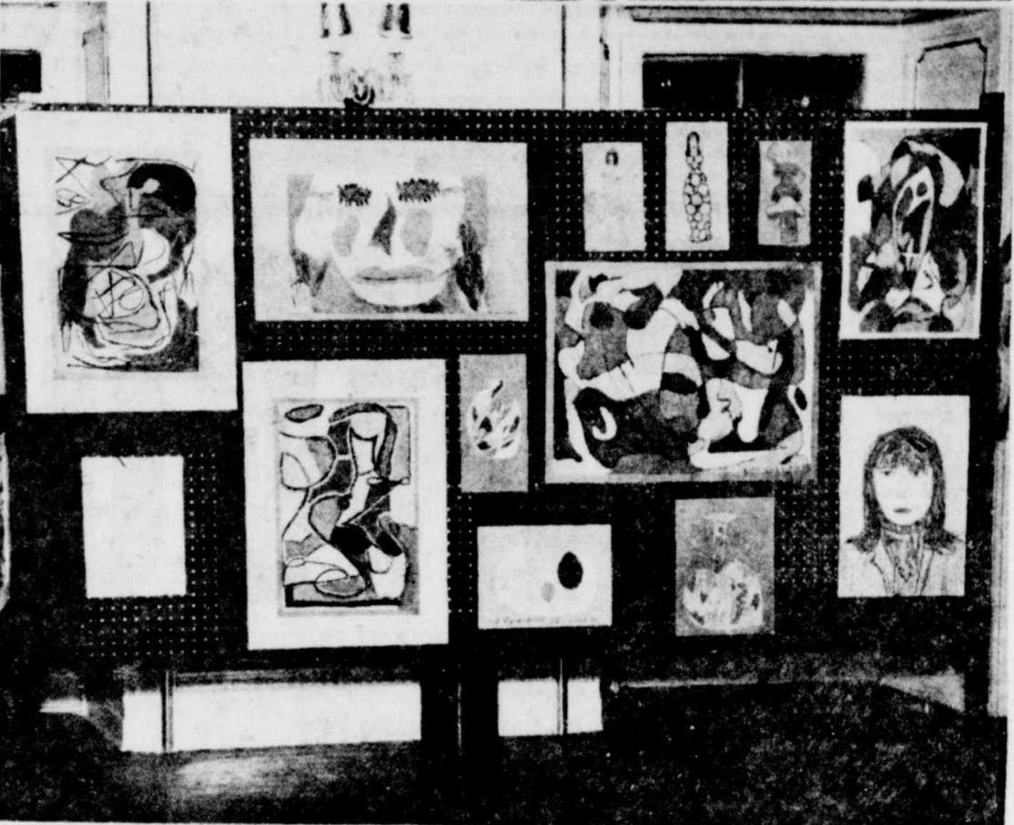
QUELQUES-UNES DES œuvres de l'exposition des travaux d'arts plastiques des élèves du cours secondaire de la Commission scolaire régionale Carignan. L'exposition a été tenue au Château des Gouverneurs de Sorel. On a pu y admirer fusain, encre pastel, gouache, croie de cire, plastiline, papier mâché, etc.