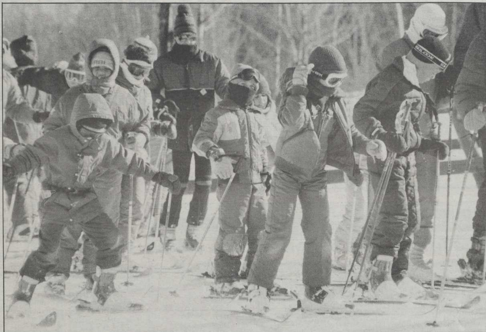
Les propriétaires de centres de ski et les amateurs de sports d'hiver jubilaient, hier, après la tempête. Cette scène a été croquée au mont Shefford, qui a connu dimanche une de ses meilleures journées de l'année.

Du côté des centres de ski, on jubilait, hier. La journée de dimanche a été l'une des meilleures