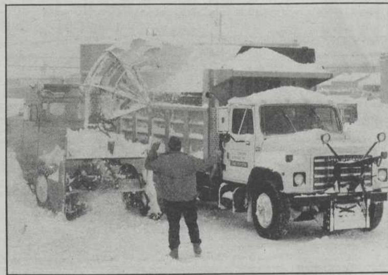
Les équipes de déneigement se sont mises à l'oeuvre pour venir à bout des 37,3cm de neige tombés pendant le week-end.

En outre, la tempête n'aura pas été tendre pour les restaurateurs qui comptaient sur la Saint-