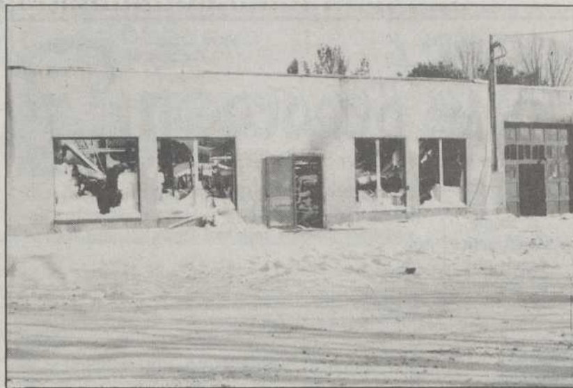
C'est dans une ancienne boulangerie que la Raymond Kyling Machinery menait ses opérations de peinture.

Personne n'a subi de blessure au cours du combat contre l'incendie.