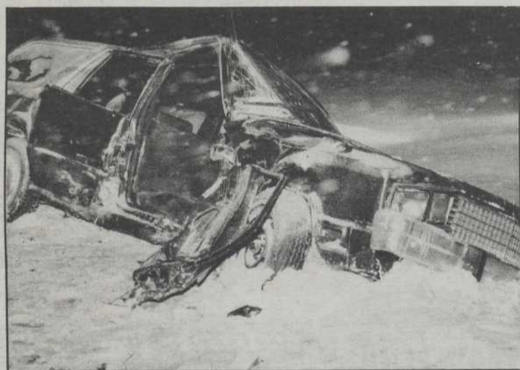
L'accident le plus sérieux de la tempête est survenu, samedi soir, à Bromont, lorsque deux voitures sont entrées en collision. Une femme a été grièvement blessée.