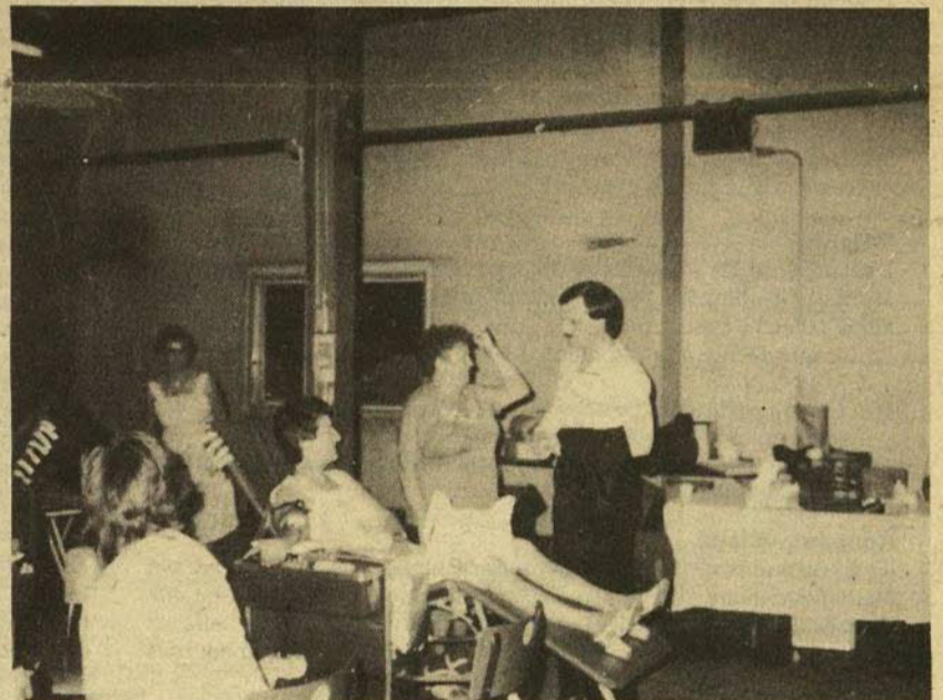
Sous l'oeil de notre président d'honneur, cette dame donne de son sang pour la première fois.