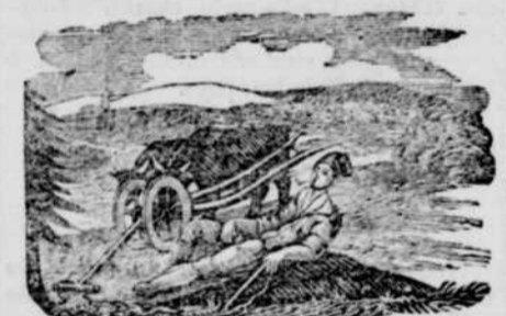
QUEBEC: MERCREDI, 4 SEPTEMBRE, 1833.

On voit par un extrait du Canadien qu'on a placé ad perpetuum rei memoriam dans les fondations de la nouvelle Salle du Parlement, le nom de plusieurs personnages liés plus ou moins avec l'érection de cet édifice, comme le gouverneur actuel de la Province, les deux évêques des prédécesseurs desquels ce terrain était et représente encore la propriété, ceux des commissaires qui ont présidé aux travaux, et ceux de l'architecte et de l'entrepreneur. Nous scrupules en voyant le nom du Gouverneur figurer dans un édifice destiné à un corps avec lequel il est en perpétuelle opposition. Mais ce qui est singulier c'est que parmi ces noms rien ne rappelle cette destination législative, et qu'on ait tout à fait oublié le nom du président de la Chambre d'Assemblée. Il semble qu'il se présentât assez naturellement, quand même on eût dû par une courtoise formaliste y mettre aussi le nom du président du Conseil Législatif. (Ib.)