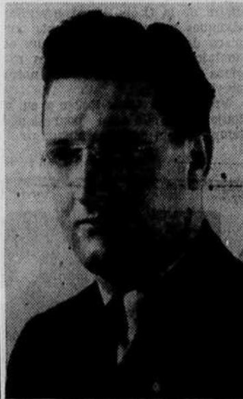
M. REAL CAOUCETTE CREDIT SOCIAL