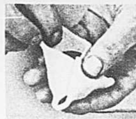
Les surprises d'un grand-père. En remplaçant tout simplement les garnitures des grands-pères, on peut créer de nombreux desserts.