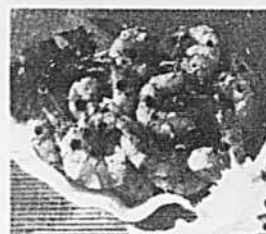
Des fruits de mer irrésistibles. Ces crevettes Arnaud se préparent en moins de 20 minutes!