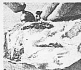
Des farces à tout faire. Une farce aux épinards et aux épices relève délicatement le goût d'un jambon.