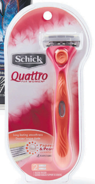
Rasoir Quattro de Schick pour dames N° 30050692.

nouveau prix plus bas 3 $ chac. Coûtait 3,16