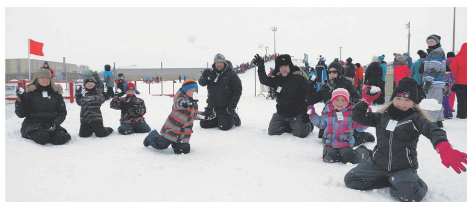
Les familles Boisvert, Brisebois et Alexandre étaient heureuses de pouvoir enfin profiter de la neige.

Six équipes ont par ailleurs participé au tournoi d'Ultimate frisbee, samedi. Elles ont eu droit