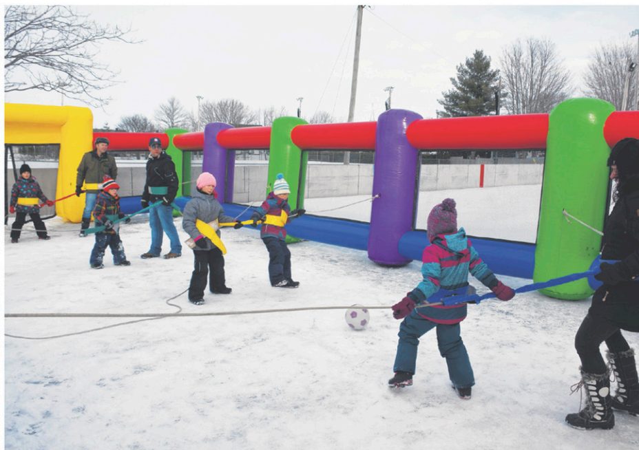
Saint-Paul-de-l'Île-aux-Noix a officiellement lancé la campagne Plaisirs d'hiver le week-end dernier, avec son carnaval. Du baby-foot humain y était organisé.

Les visiteurs pourront y jouer au hockey bottines et s'amuser sur la glissade aménagée. Un service gratuit de prêt de raquettes sera aussi à la disposition des familles. Celles-ci pourront profiter du sentier pédestre et prendre part à une chasse au trésor.