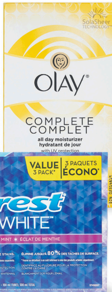
Hydratant de jour Olay Complet N° 30705828.

nouveau prix plus bas 6 96 le paq. Coûtait 7,96