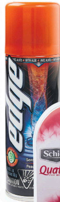
Gel à raser Edge N° 208483.

nouveau prix plus bas 9 47 chac. Coûtait 9,97