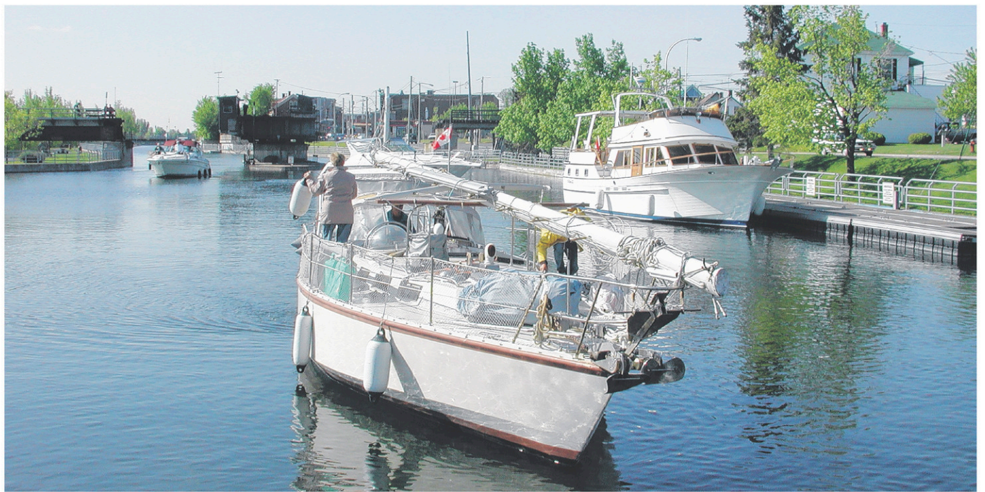
Plusieurs formations sur la sécurité nautique et la navigation sont offertes cet hiver à Saint-Jean-sur-Richelieu.

nautique de 24 heures est offert les lundis, du 20 février au 24 avril. La carte de conducteur d'embarcation de plaisance est un prérequis pour suivre le cours de navigation.