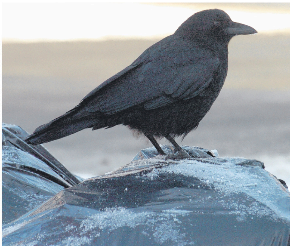
La Ville de Saint-Jean-sur-Richelieu demande aux citoyens de suivre quelques consignes afin d'éviter que leurs ordures soient étalées sur le sol par les corneilles.

Les citoyens sont invités à disposer dans