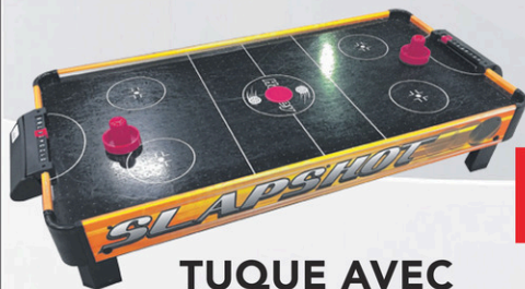
TABLE DE AIR HOCKEY Rég. 90,99$

TOUJOURS PLUS D'ÉCONOMIES POUR TOUTE LA FAMILLE