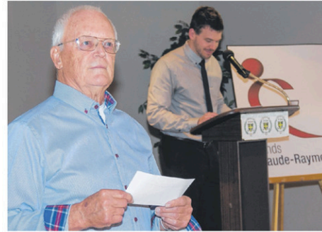
Les dons seront remis lors de la soirée annuelle du Fonds Claude-Raymond au mois de mai.

Les jeunes et organismes ont jusqu'au 20 mars 2017 pour soumettre leur demande. Le comité des dons, présidé par Delphine Rémillard-Labrosse, analysera chaque demande.