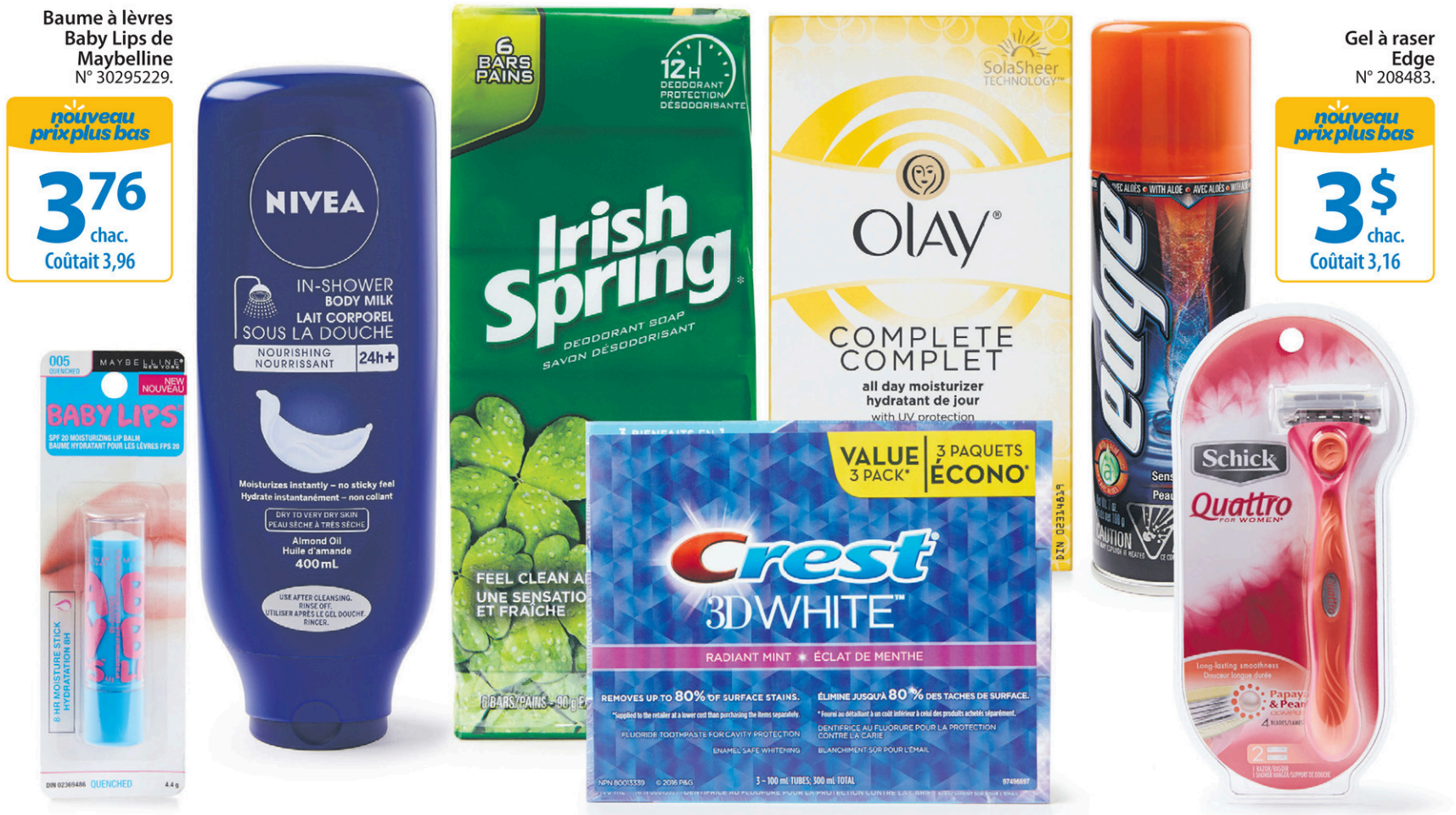
Baume à lèvres Baby Lips de Maybelline N° 30295229.

nouveau prix plus bas 3 76 chac. Coûtait 3,96