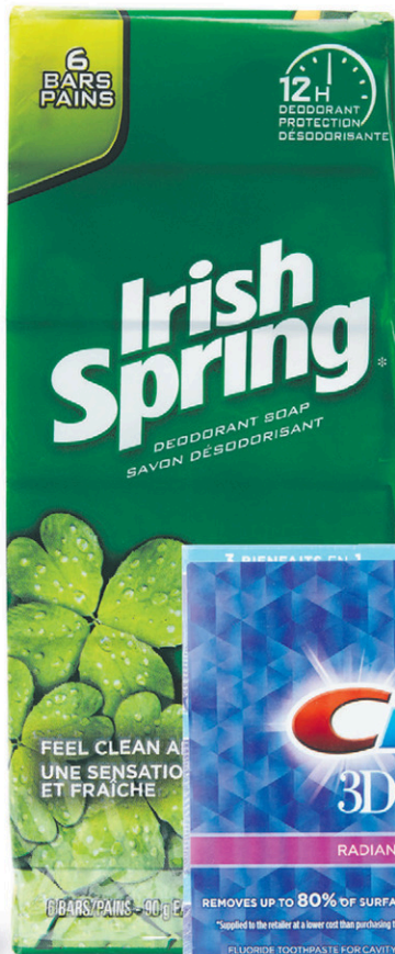
Paq. de 3 tubes de dentifrice Crest 3D White N° 31237935.

nouveau prix plus bas 3 78 le paq. Coûtait 4,28