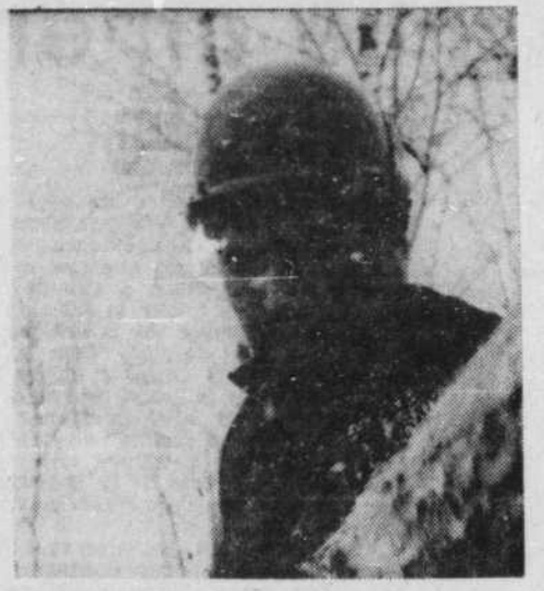
"Bucherons de la Manouane" de A. Lamothe

Pendant ce temps, la télévision, phénomène de masse peu commun, menant tous les combats artistiques, libéra des formes nouvelles d'intelligence et de sensibilité. Une génération naquit qui lit l'image avant l'écriture. Des cours de cinéma se donnent dans certaines écoles secondaires; les étudiants, jouant au nouveau Cocteau, émerveillés de faire des images, réalisent des films que financent leur collège; l'université de Montréal tente et réus-