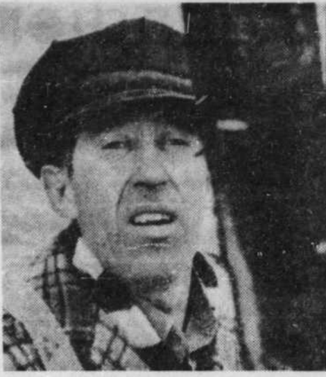
"Pour la suite du monde" de Brault et Perrault

Tout le cinéma canadien ne se fait pas à l'Office national du Film. Il existe aussi des expériences isolées, des aventures paradoxales et sans doute nécessaires d'un cinéma qui s'essaye à vivre. "Outsider" le plus important, "Crawley Films Ltd" (Ottawa) est spécialisé dans "les films publicitaires à valeur artistique". Il présente au Festival du cinéma ca-