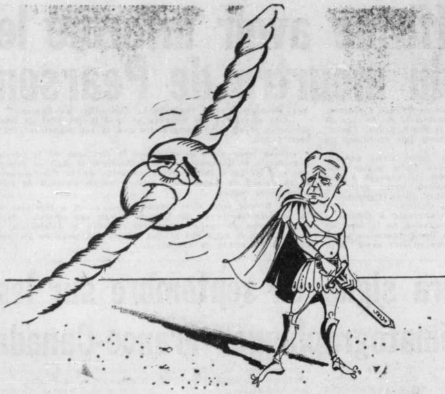
Lionel Chevrier, s'appropriant à trancher le noeud "gordien"...

ment prévoir que les syndicats de la F.T.Q. seront l'objet de fortes pressions dont le but sera de les empêcher d'adhérer au P.S.Q. On peut s'attendre à des luttes vigoureuses. Ce n'est pas seulement l'opinion nationale qui sépare les deux tendances du socialisme québécois, c'est aussi l'option proprement doctrinale. Le N.P.D. n'est pas un parti socialiste mais, disons, un parti modérément socialisant, une version mitigée du Labour britannique dont il exhibe d'ailleurs l'un des dirigeants à chacun de ses congrès. Le P.S.Q., par contre, désireux de sortir de l'équivoque, se veut résolument socialiste en même temps qu'il entend définir un type de socialisme adapté à la situation globale du Canada français. Et ce socialisme ne saurait s'instaurer sans la plus large mesure possible d'autonomie pour le Québec. Il reste à voir si l'opinion publique, même dans les clas-