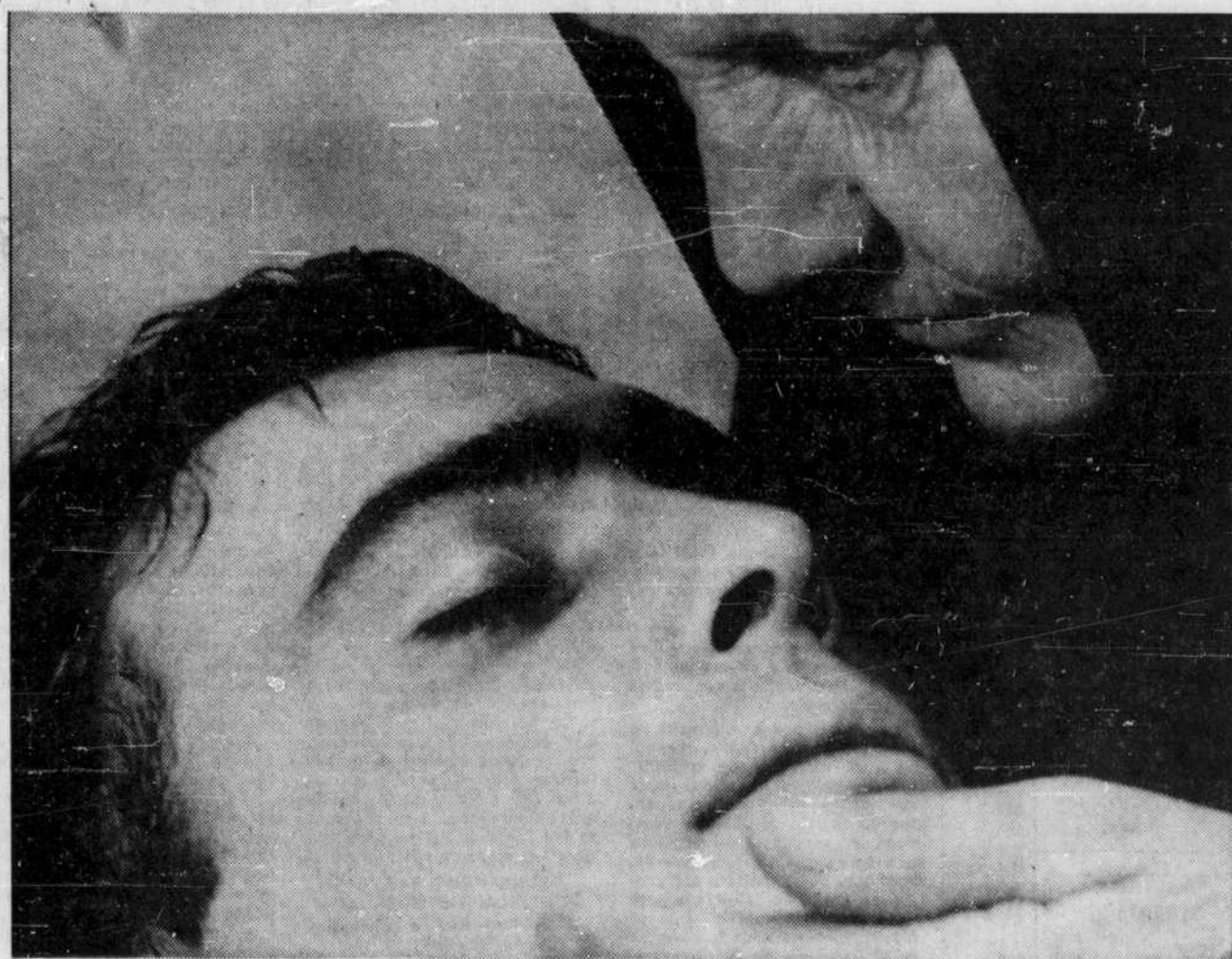
Drame sicilien où le bandit n'en a pas moins une mère. Une image de "Salvatore Giuliano" de Francesco Rosi. De 7 à 9 heures 15.