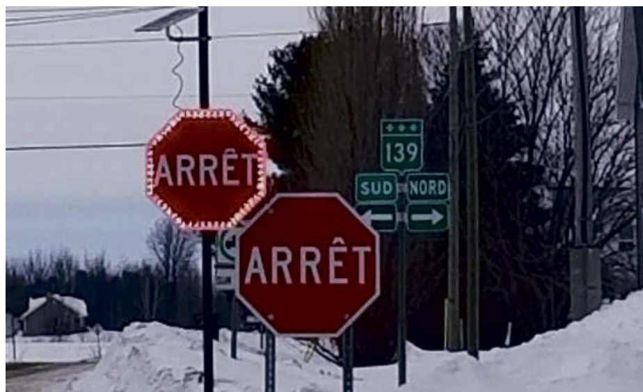
De nouveaux feux de circulation ont été installés à l'intersection du 9 e Rang et de la route 139, à Wickham.

« Il est encore trop tôt pour savoir si ça fait une différence, mais les citoyens apprécient beaucoup cette mesure de sécurité. Je suis convaincue que les automobilistes feront davantage attention », conclut Mme Côté.