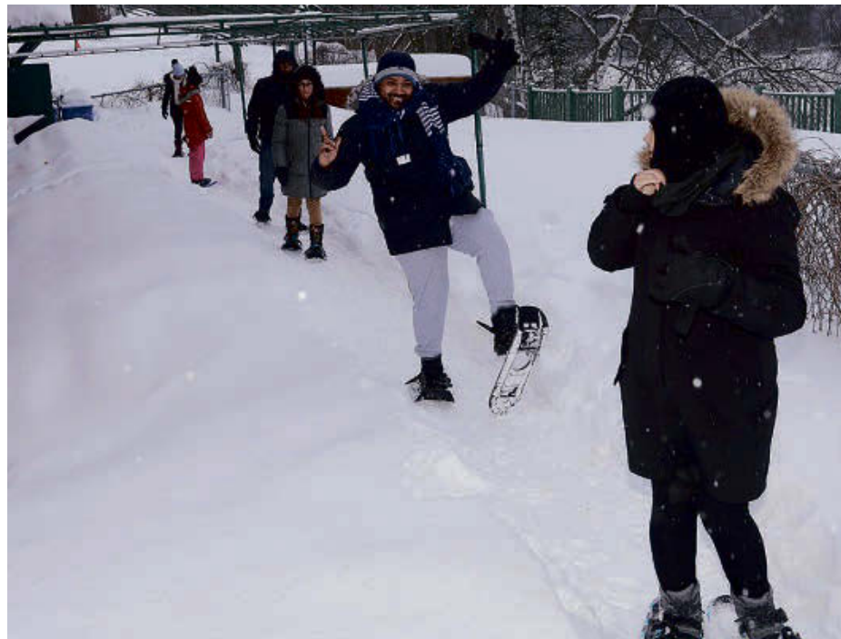
Place aux jeunes en région Val-Saint-François a récemment accueilli 20 personnes immigrantes lors d'un séjour exploratoire interculturel, qui a entre autres fait escale à Valcourt.