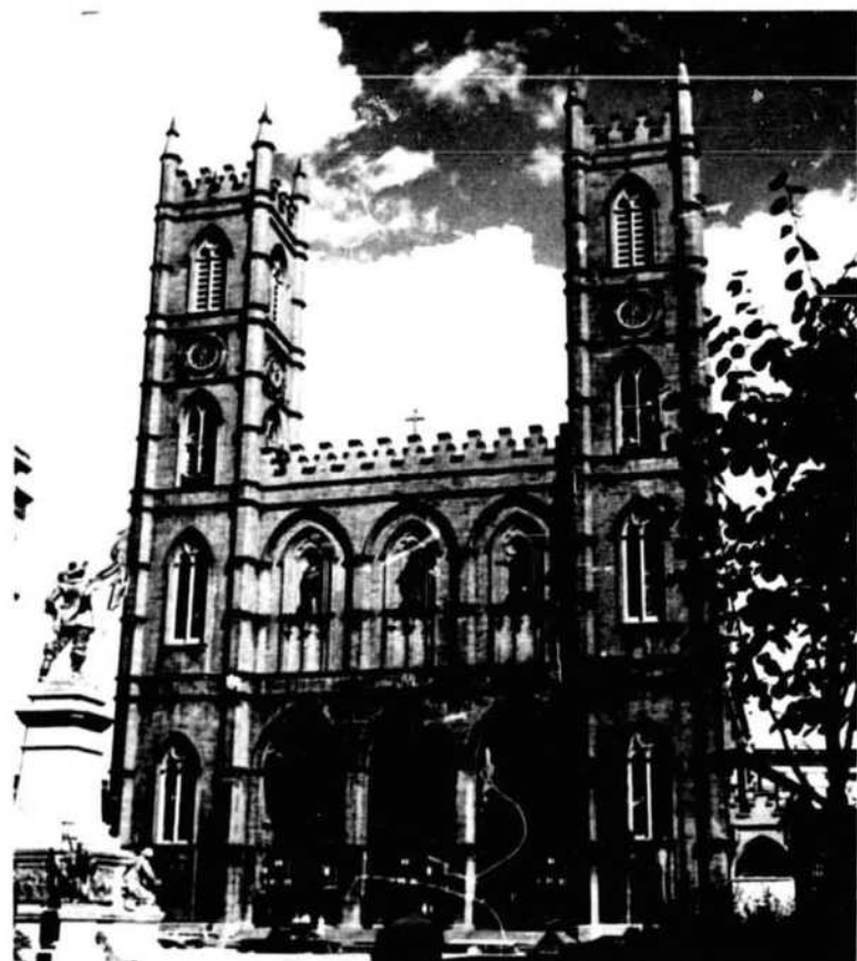
Notre Dame Church, Place d'Armes

The City, at the end of the struggle between France and England for supremacy of North America, capitulated on September 8th, 1760. During the American Revolution, the city was held by the Congress troops from the capitulation of November 13th, 1775, until evacuated by Benedict Arnold in June, 1776. After this trade began to develop: the Northwest Company, fur traders, was established at Montreal in 1783-4, the "X.Y." in 1795-1804, and both amalgamated with the Hud-