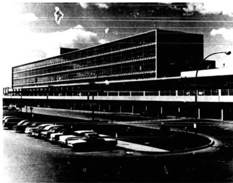
Aéroport International de Montréal, Dorval

son's Bay Company in 1821. British traders were consolidated before and during the last decade of the eighteenth century. In 1804 the Phoenix Fire Insurance Company, the first insurance company in Canada, started here. In 1809 the S.S. "Accommodation" was built by John Molson, of Montreal, for river traffic, the second steamer on North American rivers, and three years before any such steamer plied in England. The Bank of Montreal opened for business on November 13th, 1817. The Committee of Trade, the predecessor of the Montreal Board of Trade of 1842, was organized in 1822. The Lachine Canal, begun on July 17th, 1821, was finished in 1825. The first Harbour Commission was appointed in 1830. In 1831 the "Royal William" was fitted with its engines in the yards of Bennett & Henderson,