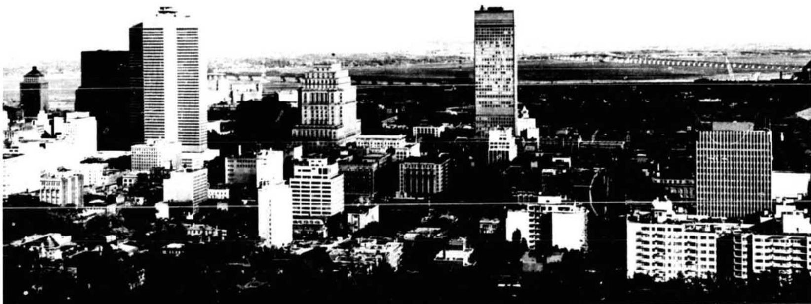
General view of Montreal from Mt. Royal