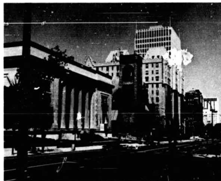
Montreal Museum of Fine Arts, Sherbrooke Street West Musée des Beaux-Arts de Montréal, rue Sherbrooke ouest

l'Ile-Jésus, traverse la rivière des Mille-Iles jusqu'à Rosemere, puis se rend à St-Jovite. C'est une voie divisée avec cinq postes de péage, 67 ponts et croisements pontés.