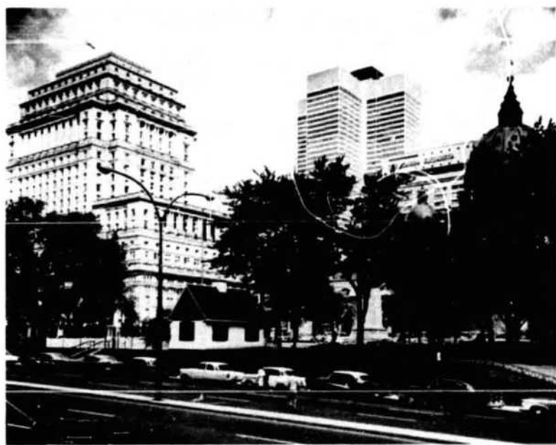
Place du Canada

30 miles long and 7 to 10 miles wide, with an area of 194 square miles. The present City covers over 43,734 acres, having, by annexation, especially in 1883, grown from the 5,000 acres of 1860. It occupies one-quarter of the island and is 68 square miles in area.