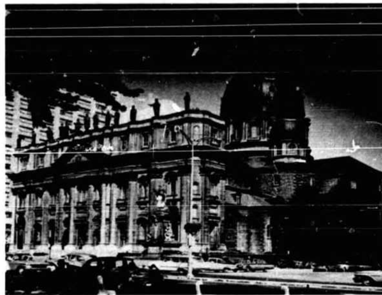
Cathédrale Marie Reine du Monde, boulevard Dorchester ouest Basilique Cathédrale Marie Reine du Monde, Dorchester Blvd West

Being at the junction of inland ocean transportation and mainly by reason of being the financial, industrial and commercial Metropolis of Canada, Montreal occupies, and must long continue to occupy, a unique position among the ports of this continent. This port constitutes the funnel through which pass to Europe the harvests from millions of acres of wheat and grain lands of the West and the agricultural, mineral, forest and industrial products of a great country.