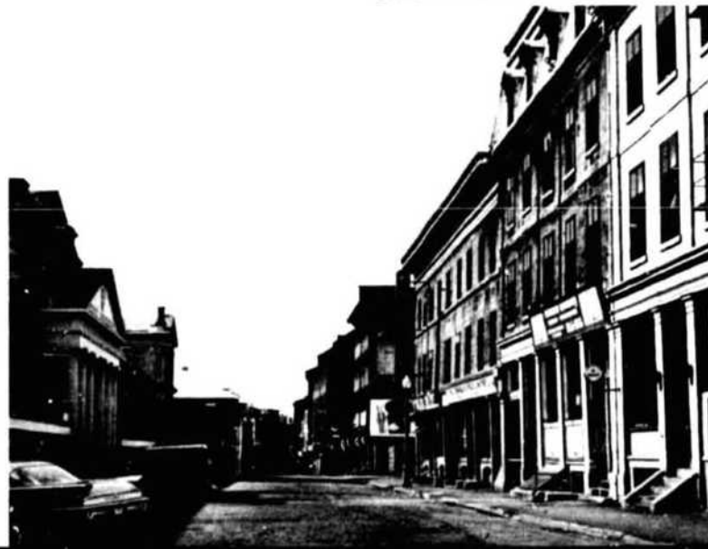
St. Paul Street in Old Montreal