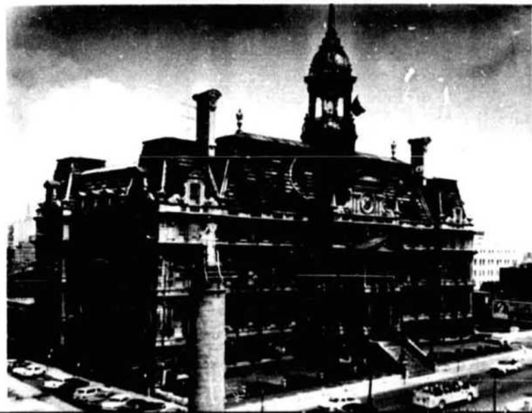
Hôtel de Ville de Montréal, rue Notre Dame est