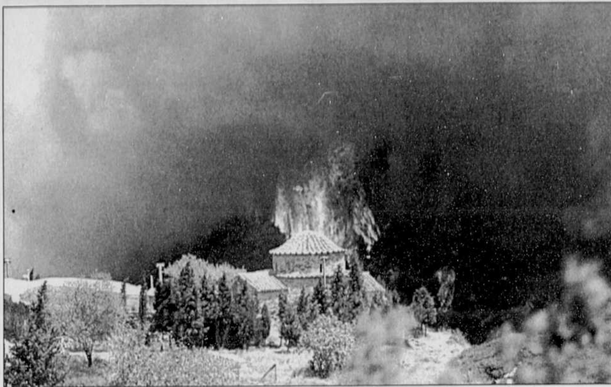
Les flammes ravagent depuis vendredi la forêt des environs du monastère d'Agios Nicolaos, à Pendeli, au nord-est d'Athènes, en Grèce. L'élément destructeur a ravagé 6000 hectares de forêt, envoyé une dizaine de pompiers à l'hôpital et détruit vingt-cinq maisons.