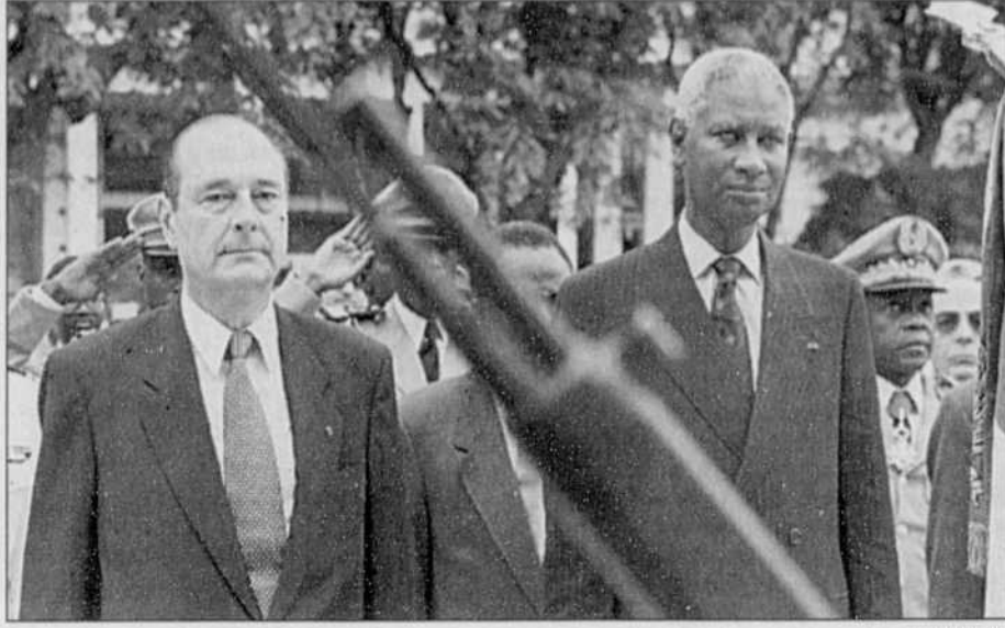
À Dakar, hier, avec le président sénégalais Abdou Diouf.

Tournée éclair difficile pour le président français sur le Continent noir