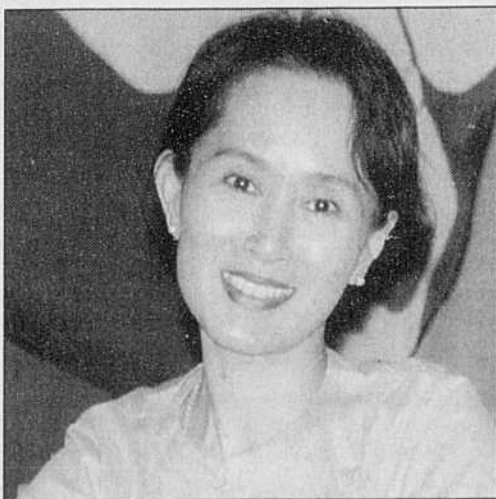
La détentrice du prix Nobel Aung San Suu Kyi.

Ces antécédents familiaux amènent Aung San Suu Kyi à s'intéresser à d'autres leaders asiatiques qui auront lutté contre les puissances coloniales. Elle cache mal son admiration pour les intellectuels indiens de tout acabit, dont évidemment Nehru. Cela ne surprend guère, surtout si l'on sait à quel point Aung San et sa famille étaient près des Nehru-Gandhi. L'admiration vole souvent les sens critique des individus, ce qui empêche