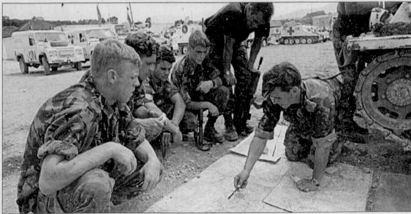
Les soldats étrangers en Bosnie-Herzégovine passeront-ils à l'attaque contre les milices serbes?

Nouveaux récits de massacres en Bosnie-Herzégovine tandis que le pape intervient sur l'usage de la violence