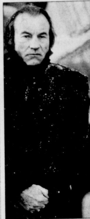
Patrick Stewart est le capitaine Achab dans le film «Moby Dick».

Les MétroStars américains. Qui sont les chouchous de nos voisins du sud à la télévision, au cinéma et en musique? En provenance de Pasadena en Californie. The 26th Annual People's Choice Awards, CTV, 21 h