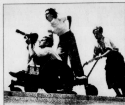
Leni Riefenstahl en tournage.

De Clarice Starling à Anna Leonowens, Jodie Foster aime les rôles de femmes déterminées