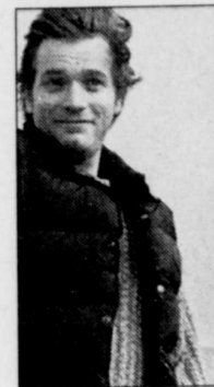
Ewan McGregor. Il avait tourné dans Saint-Jean-Baptiste quelques scènes de « Eye of the Beholder », qui prend l'affiche ce mois-ci.