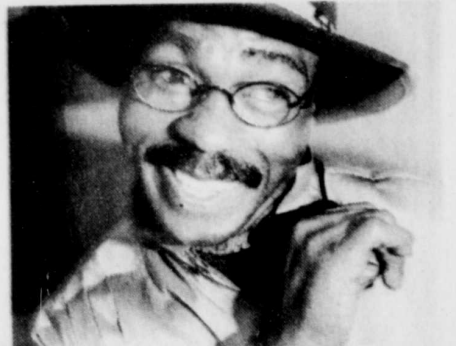
Rubin (Hurricane) Carter, le vrai

L'histoire de l'injuste condamnation du boxeur Rubin Carter