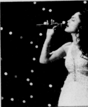
Jennifer Lopez incarne la chanteuse Selena.