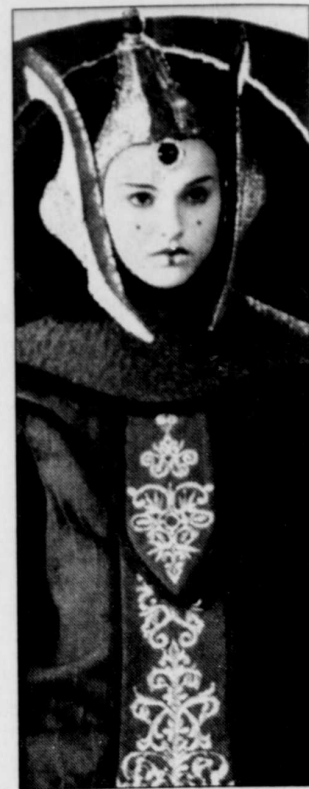
« Star Wars — La menace fantôme », la saga intergalactique de George Lucas, a amassé 7,8 millions $ au Québec en 1999, loin devant son plus proche rival, « Les Boys 2 » (5,5 millions $).