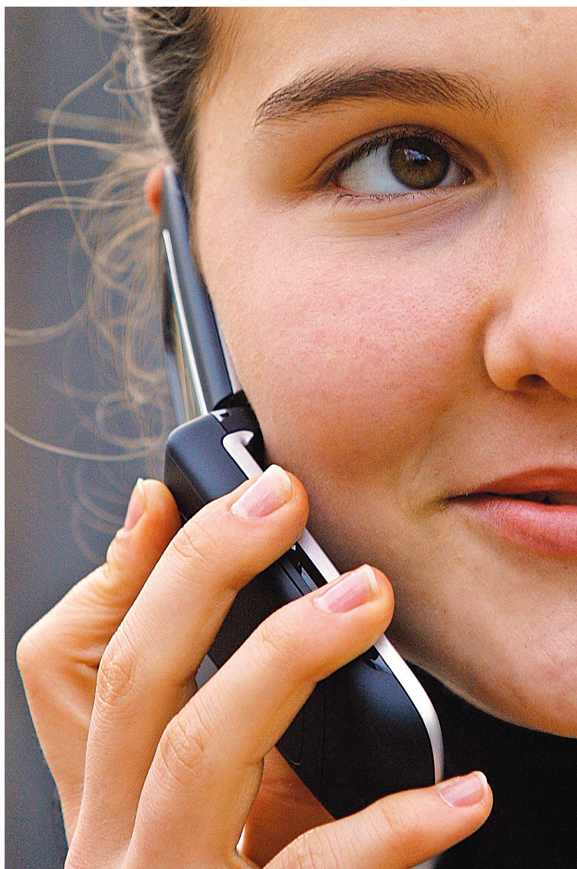
IVAN MILUTINOVI REUTERS