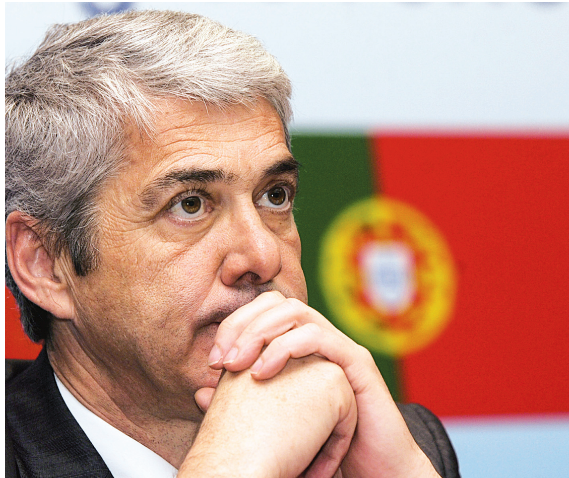
José Socrates, premier ministre du Portugal

«Le principal problème du Portugal c'est qu'il ne semble pas en passe d'atteindre ses objectifs de consolidation. Si le gouvernement n'y arrive pas