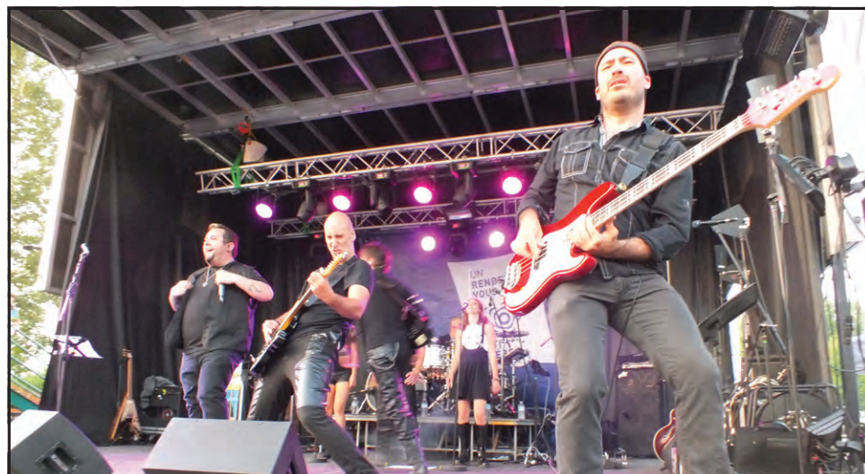
▲ Quelques-uns des membres du collectif «Les Vikings».