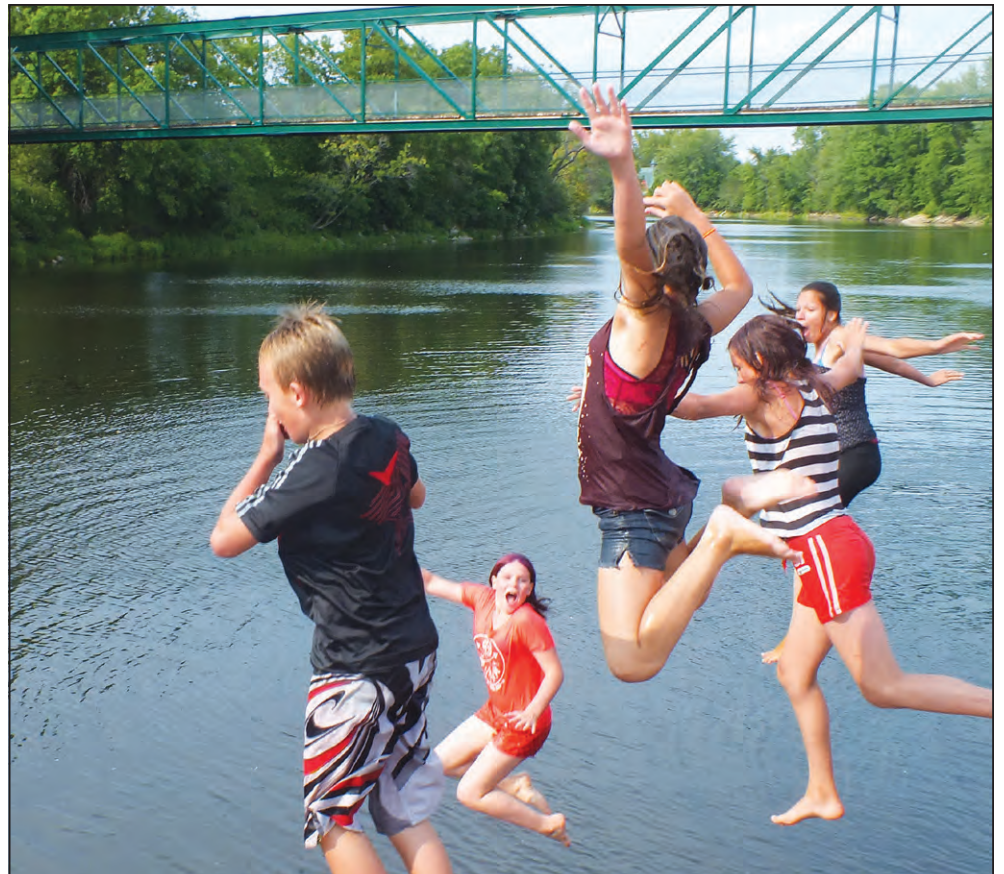
▲ Le samedi après-midi, des activités étaient proposées aux familles. Les enfants s'en sont donnés à cœur joie.