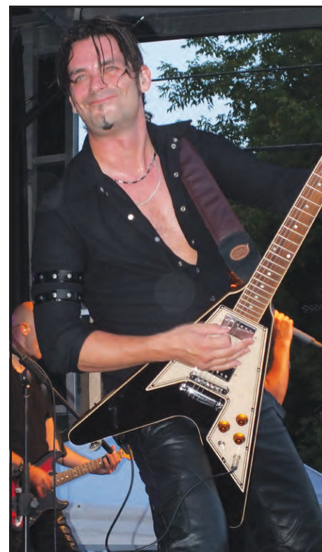
▲ L'un des musiciens du collectif «Les Vikings».