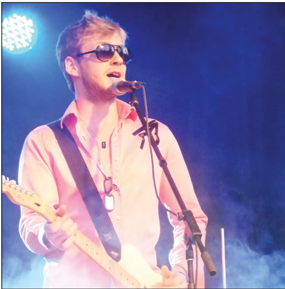
▲ Grand chouchou du festival : Yoan, gagnant de la dernière édition de La Voix.

MANIWAKI - De 5 000 à 6 000 personnes le vendredi, près de 10 000 le samedi. La 8 e édition du Festival d'été de Maniwaki a été un succès. Une dizaine de spectacles et d'activités familiales étaient présentés rue des Oblats.