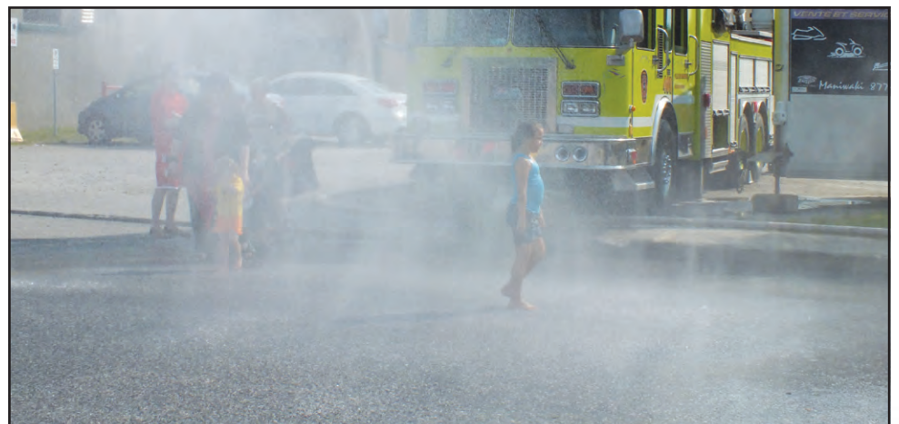
▲ Les pompiers de la Ville de Maniwaki proposaient aux enfants de se rafraîchir et de s'amuser dans l'eau.