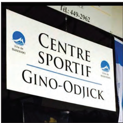
▲ La bannière officielle du Centre sportif Gino-Odjick.