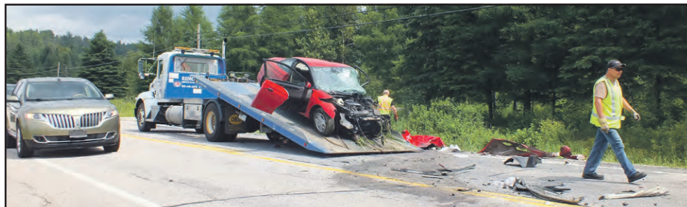
▲ Un accident s'est produit sur la 105 à Bois-Franc. Le conducteur d'une voiture, qui tentait de dépasser un 45 pieds, a perdu le contrôle et percuté le côté du fardier.