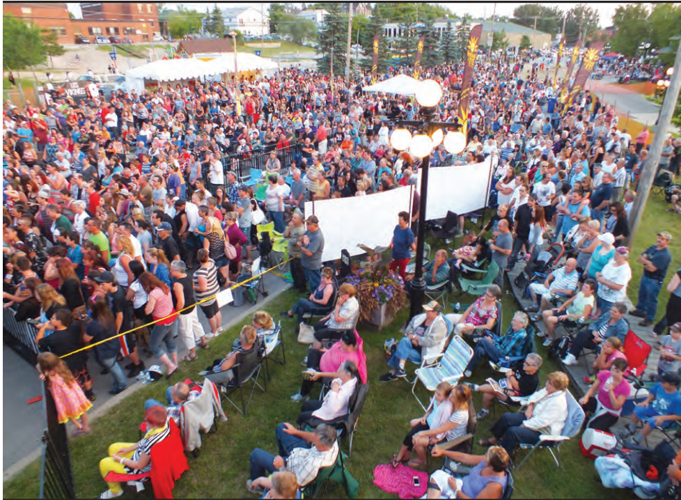
▲ La foule rassemblée le vendredi soir rue des Oblats.