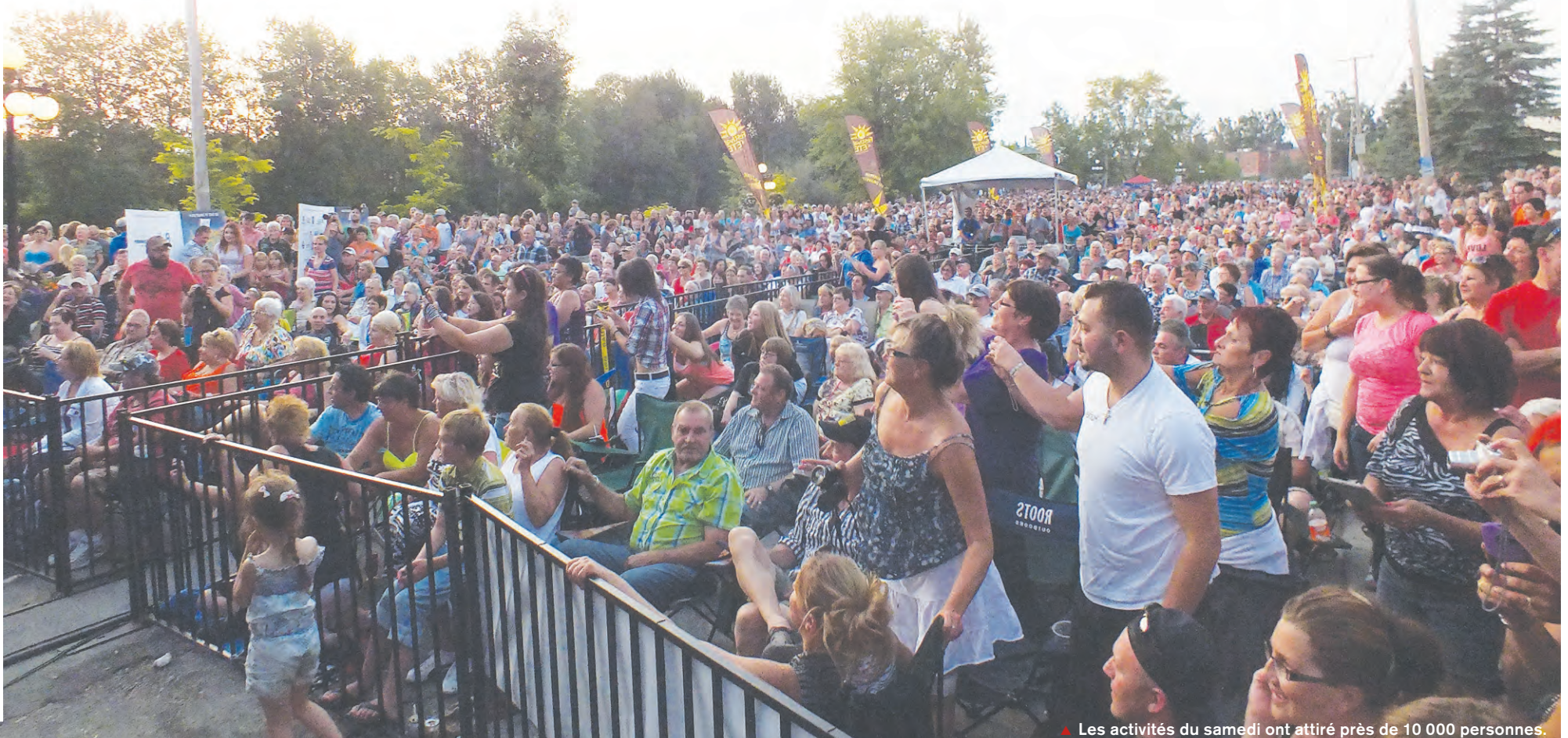
▲ Les activités du samedi ont attiré près de 10 000 personnes.