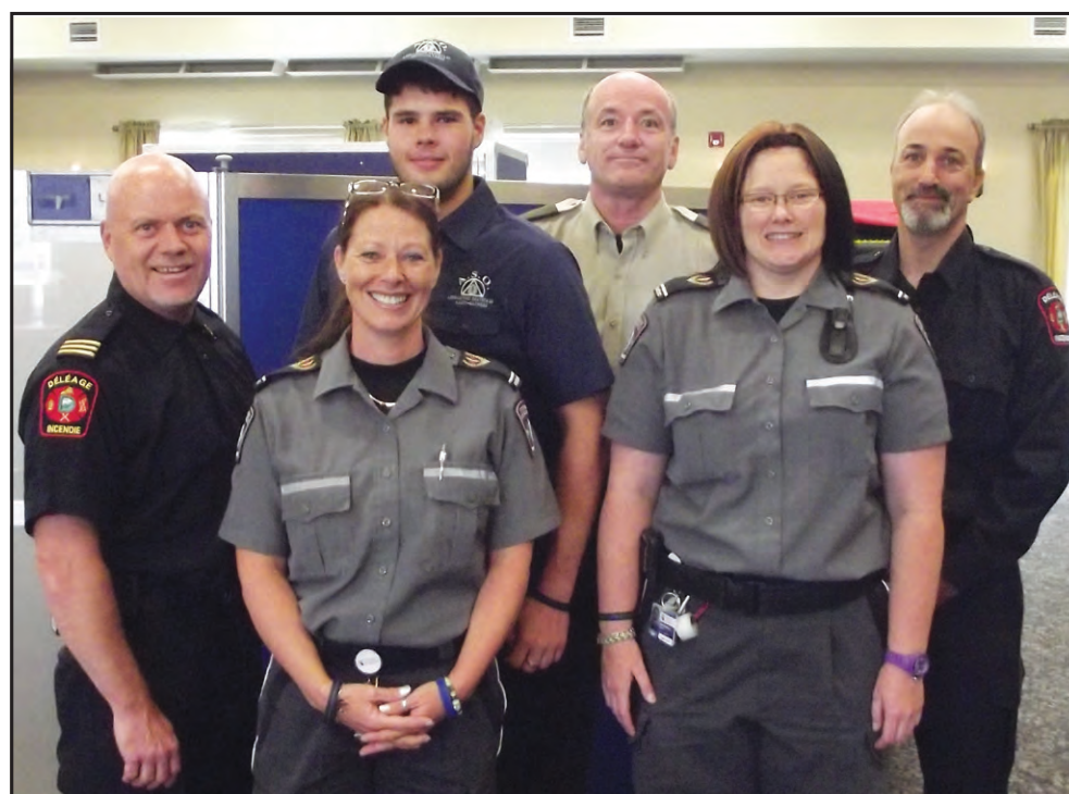
▲ Une partie de l'équipe des services d'urgence de la région qui organisait, en collaboration avec Héma-Québec, cette clinique de sang.