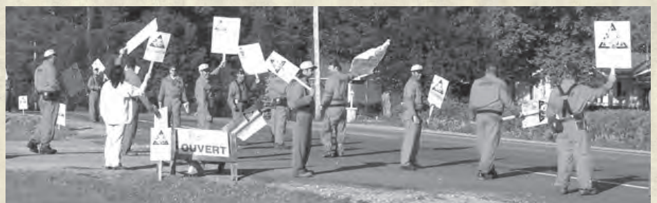
Les pompiers forestiers de la SOPFEU de la base de Maniwaki ont manifesté, mercredi matin, devant les locaux de leur employeur