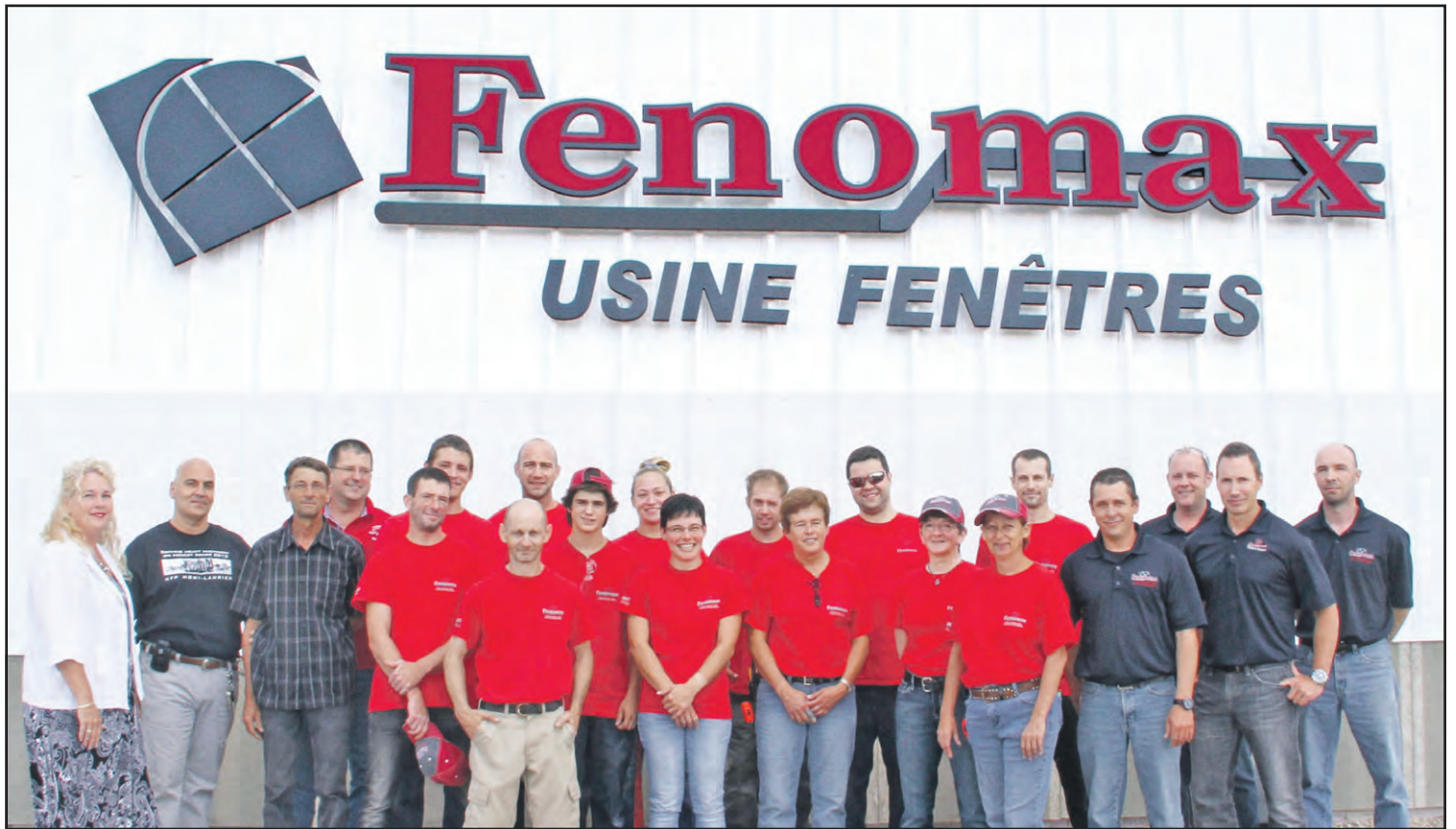
▲ Le Centre de formation professionnelle de Mont-Laurier a offert une formation en assemblage de portes et fenêtres, en collaboration avec l'entreprise Fenomax qui a une antenne notamment à Maniwaki.

D'une durée de 555 heures, cette attestation d'études professionnelles (AEP), offerte à temps plein du début février à la mi-juin 2014, était constituée d'un judicieux dosage d'apprentissages théoriques et pratiques. Les élèves ont étudié notamment les connaissances de base liées à la fabrication de portes et fenêtres, développé les habiletés