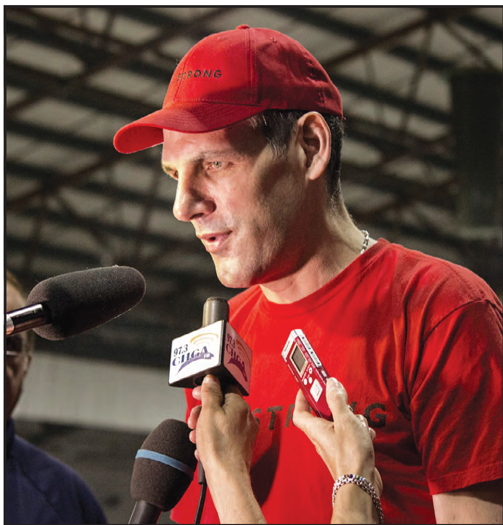
▲ Gino Odjick s'adressant aux médias avec force et fierté.

cette cérémonie était «confirmée» depuis le 16 juillet dernier, quoique incertaine, étant donné son état physique. Il semblait très heureux et surtout touché qu'un événement du genre ait lieu dans sa ville natale. Il a toujours été reconnu comme étant un combattant sur la glace, et il l'est tout autant en faisant face à cette maladie. Il a même mentionné à «Ici Radio-Canada» : «Je vais tout faire pour guérir de cette maladie».