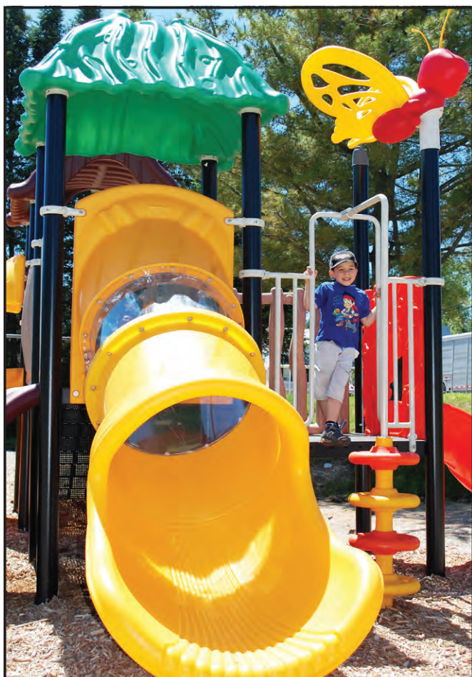
▲ Nouveauté à Aumond : un joli parc pour enfants avec un module de jeux et des balançoires. Des jeux d'eau devraient être en fonction prochainement.

Le Centre d'interprétation du Cerf de Virginie est un incontournable à Ste-Thérèse. Les tout-petits et leurs parents adorent rencontrer les jeunes chevreuils dans leur environnement naturel, avant qu'ils ne soient relâchés en nature. Selon les heures de visite, on peut voir les gardiens nourrir les bébés au biberon. Ces petits gourmands charment les enfants à tous les coups.